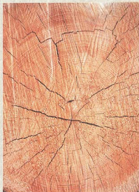
木材橫切面。

樹木由於位於樹皮（韌皮部，phloem）與木材（木質部，xylem）之間的一層稱為形成層（cambium）細胞之分化，向外分化為樹