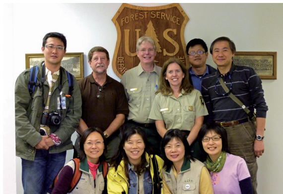
▲2009年筆者與林務局同仁拜會美國林務署喬治·華盛頓國家森林辦公室，與其接待官員合影。

其志願服務項目，主要包括遊憩、遺產計畫、野生動植物、牧場管理、森林管理、水域和空氣管理、保護、研究、商業和財務、設施營建、其他設施等十三項工作。整體而言，2008年之志工總服勤時數合計達90,665小時（平均每位志工之服勤時數高達91.7小時），