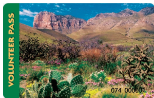
▲“America the Beautiful” Volunteer Pass志工通行證與識別標章