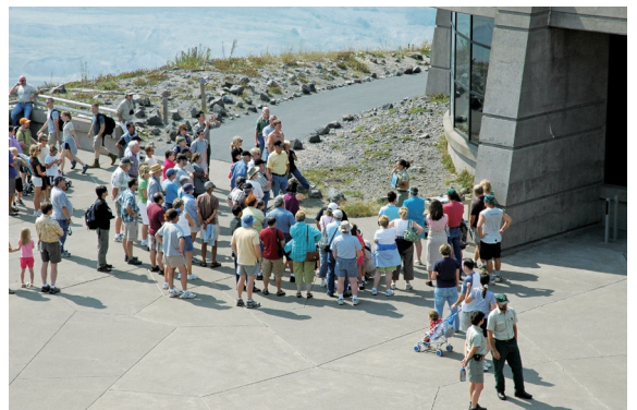
▲美國林務署志工之活動引導解說。