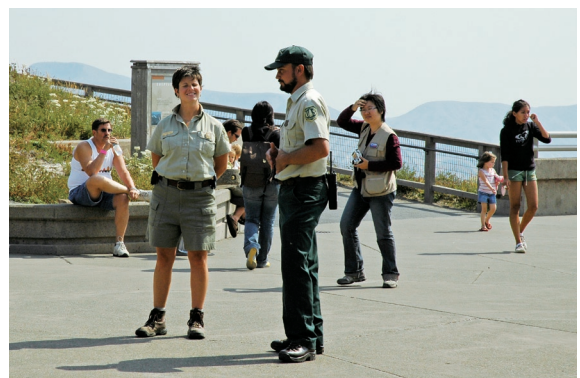
▲ 志工督導是志工計畫的推動及管理核心，圖為美國林務署志工督導協調戶外實習操作情形。