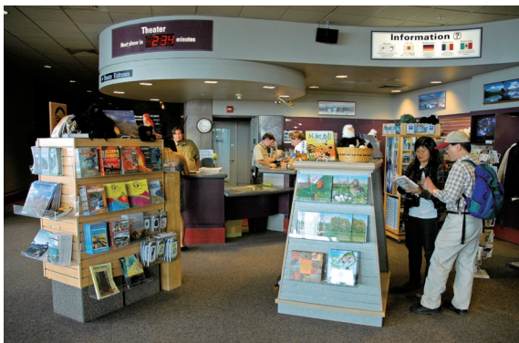
▲美國林務署志工協助遊客中心諮詢解說及出版品販售情形。

(2) 短期志工之教育訓練：對於如步道日、種植樹苗或撿拾垃圾等任務導向的計畫，志工督導可以不必事先安排訓練。志工督導可運用計畫描述、每日目標指定、技能介紹、工具用法、安全規定、緊急撤離（含無線電通訊）等重要課題的執勤前討論，協助執勤前的準備。但由於訓練不足，志工通常不能獨立作業，因此志工督導或其他管理者必須和他們一起工作，以維護安全和工作品質。