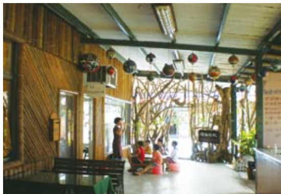
台南縣生態旅遊協會—小小洪通繪畫營分組說明

台灣的社區營造運動，發展於文建會所推出的「社區總體營造計畫」。社區營造一路走來，也經歷了十多年的歷史，其間，民間社團、社區組織也逐漸熟悉運作的過程；包含社