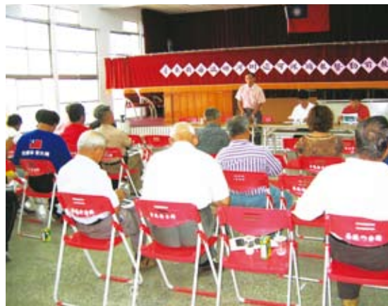
海端鄉海端社區新武呂溪河川巡守勤前說明

理論上，社區培力可以分為三個層次，組織內培力偏重於組織成員的能力培養；組織間培力以組織對外關係的確立與營造為主；至於組織外培力則為社區培力的最終目標，使社區能夠產生集體行動，反應對公共事務的看法，以及提出相對應的替代方案。社區林業計畫第一階段的「理念宣導及人才培育計畫」，與第二階段的「林業示範社區營造計畫」的內容，以強化組織成員的能力培養與組織對外關係的連結為主要。例如：組織內與組織間的培力目標可定義如下：成員是否具有相同的價值觀，與是否形塑組織文化？成員間是否有平等成長、擔任幹部的機會？是否有激勵與支持成員的機制？是否能進行非營利組織間聯盟與議題倡議等。在第一階段的理念宣導即進行共同價值觀的營造；包含生態環境的價值、永續發展的內涵，以及國際環境發展議題等。組織文化與價值觀能夠整合，才能確保組織發展的穩定性。第二階段所注重的個人專業能力的養成需要透過訓練與激勵，促成個人能力的提升。例如：山林巡守隊、解說人員團隊、林業產業訓練