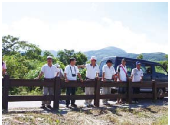
台東林區管理處轄內社區林業訪視

具有資源的可分割性、使用資源者擁擠性特質，以及「非參與者」搭便車的現象。雖然台灣森林的所有權以國有林地佔有主要比重，但森林分布遼闊，所在位置大都為人跡較少的高山地區，或森林分布與所在地部落、社區村落的发展息息相關。林業行政標準與管制的落實，需要耗費大量的人力，純粹的「命令與管制」政策工具，也逐漸無法滿足多元化社會發展的需求。從這些角度來看，在林務局採取一