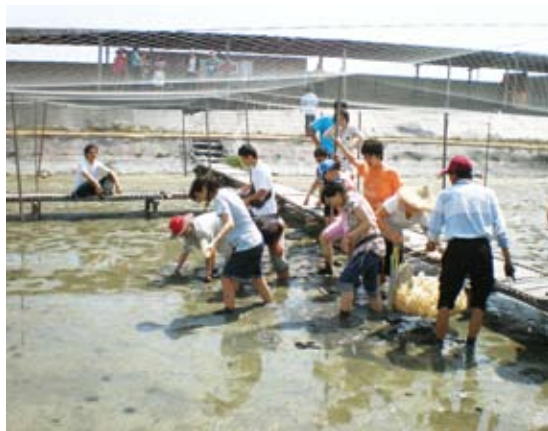
台南縣生態旅遊協會—弄花跳體驗

許多社區執行社區林業計畫著眼於第一階段的小額補助，希望每年都能夠持續自然保育、生態環境維護活動的舉辦，尤其以都會型社區與部分鄉村型社區為主要。台灣社會在經濟發展到一定程度，對社區環境品質的提升；社區的綠美化、自然保育，以及生態環境維護，都極為關注，已成為台灣社區營造及發展