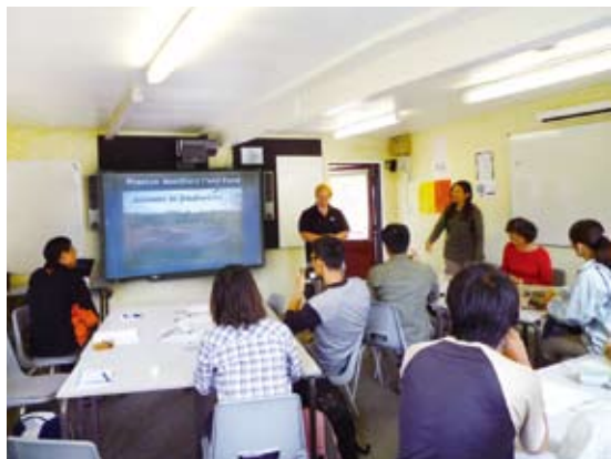
圖6 林務局承辦自然教育中心的夥伴們認真聽課