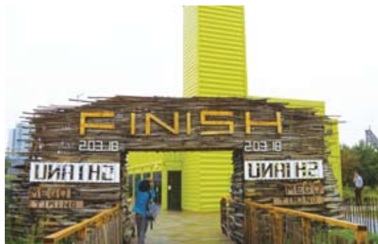
圖2 FSC於2010年1月與倫敦野生動物信託合作，設立第18個自然中心－奧林匹克公園。