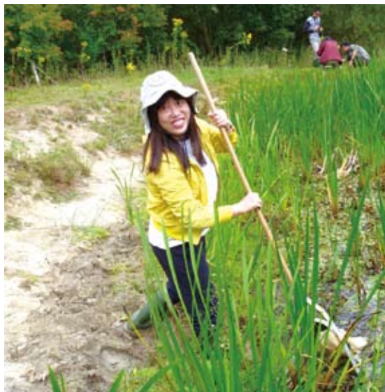
圖8 林務局自然教育中心專案教師實地操作調查課程

品質標章(Quality Badge)。另外，針對場域部份，也符合英國政府所頒發之“Eco-Centre Award”生態中心認證。