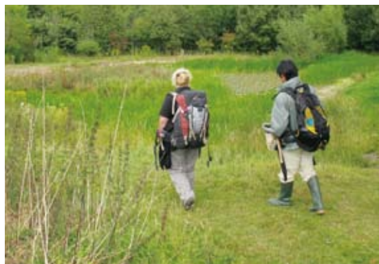
圖1 FSC致力於幫助人們了解自然並從中獲得啟發

從1990年代，新的中心布倫卡思拉(Blencathra)、布拉克霍爾(Brockhole)、凱瑟克(Castle Head)、艾瑪遜(Amersham)及馬格公園(Margam Park)陸續開放。並於2001年，FSC開放了第一個在北愛爾蘭的中心戴瑞岡那利(Derrygonnelly)。2002年FSC開始與蘇格蘭田野