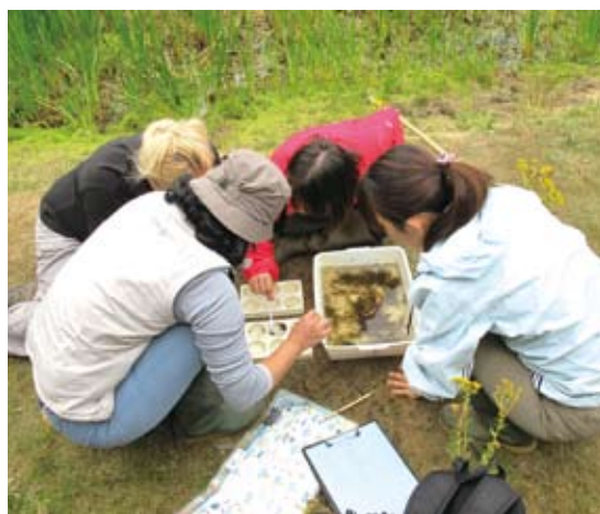
圖4 林務局夥伴於佩登斯曼佛中心進行淡水生態調查