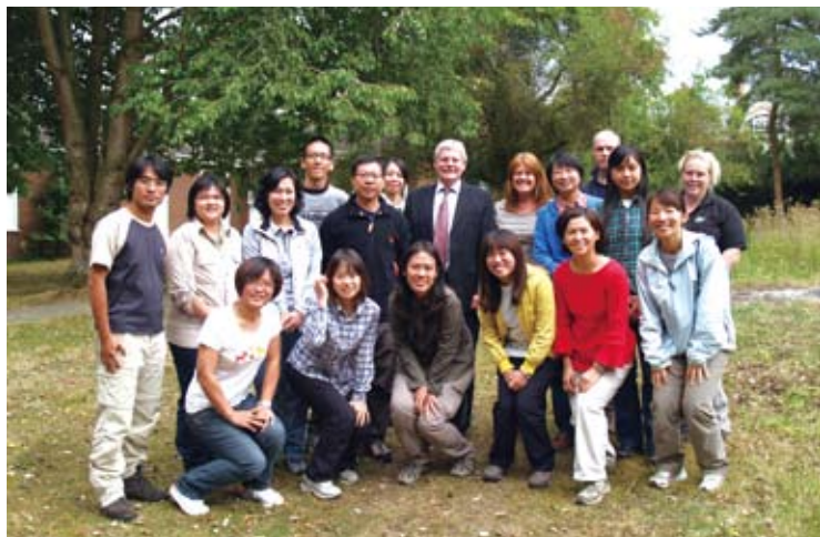
圖9 2011年林務局人員參訪FSC總部，與執行長Rob Lucas合影。