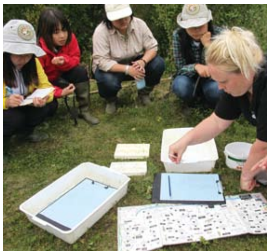
圖3 FSC資深專案教師示範埤塘調查課程

任公開招募，並由執行委員會成員進行二階段面試後決定人選。小組成員包括執行長、營運主任、行銷推廣主任、財務主任等。