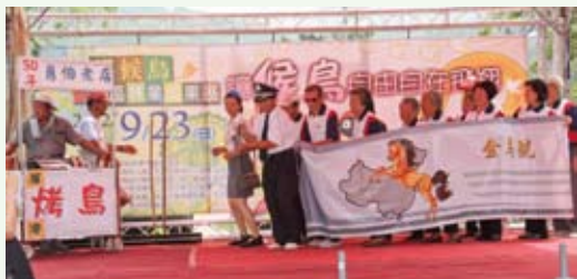
由楓港社區發展協會表演的舞台劇—讓伯勞自由自在飛翔，贏得熱烈掌聲。(攝影／屏東林區管理處 羅國文)

以及多部入圍綠色奧斯卡影展的生態影片，吸引許多民眾參與，場面相當熱絡，深獲社會各界好評。(屏東林區管理處 楊中月)