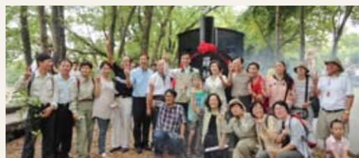
羅林號重現，民眾搶著合影。(攝影／羅東林區管理處 傅正儀)

出不同時代與背景，讓參加的民眾一睹太平山的古往今來，也見證了林業的蛻變與成功轉型。(羅東林區管理處 吳思儀)