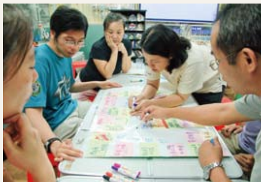
環境教育課程規劃的實作與案例討論。