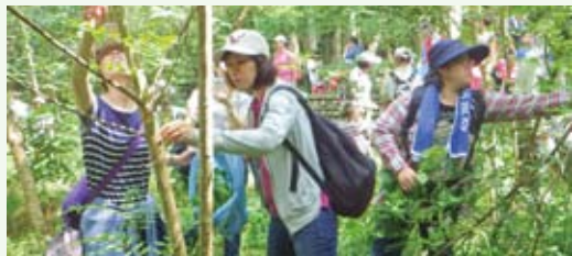
高都汽車員工動手做環保與林業單位共同拔除小花蔓澤蘭。