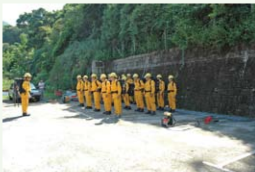
新竹林區管理處烏來工作站防火隊員整裝集結。(攝影／新竹林區管理處 吳芳滿)

時序已進入乾燥季節，林務局新竹林區管理處為加強防範森林火災發生，101年9月26日在烏來工作站召開「101年度防範森林火災座談會」，邀請烏來站轄區內警、消、地方行政機關等，共同就如何有效防止森林火災發生及森林火災發生時如何攜手搶救，進行意見交換與交流。會後新竹林區管理處烏來工作站救火隊員整裝集結，進行裝備檢查及機具保養、發動，整體防火隊員整備情形良好。(新竹林區管理處 謝光普)