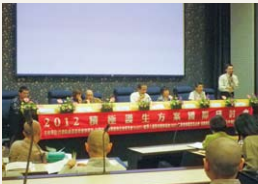
積極護生方案國際研討會中專家學者和與會者進行交流討論。(攝影／林務局 蔡恩恩)

林務局101年9月25至26日在台灣師範大學公館分部綜合館國際會議廳舉辦「2012積極護生方案國際研討會」，會中廣邀來自美國佛教聯合會、中國綠野方舟組織、香港嘉道理農場暨植物園(KFBG)等國、內外學者專家進行八場積極護生方案的演說，最後亦開放綜合討論時間，希望各大宗教團體與關心放生活動者齊聚研討會，共同為促進環境生態、動物保育與福利而努力。(林務局 蔡恩恩)