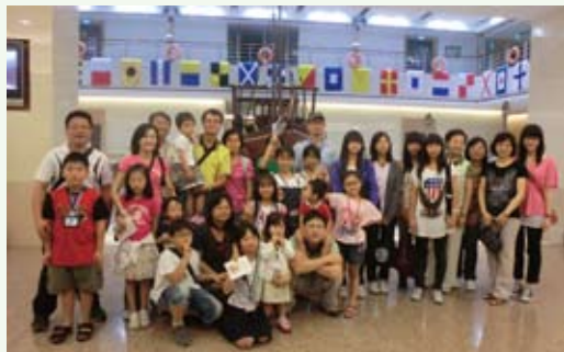
同仁及同仁眷屬參訪長榮海事博物館合影。