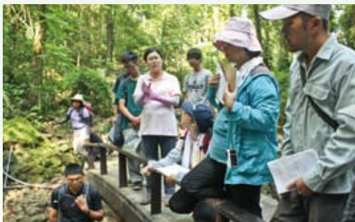
屏東林區管理處培養美濃當地居民參與保護區資源監測工作。

林務局擬劃設美濃黃蝶翠谷自然保護區，為了讓周邊社區居民瞭解保護區劃設目的、保育標的、社區可參與項目及未來分區經營管理規劃的相關限制，101年8月18日及21日在高雄市美濃區分別辦理3場地方座談會。希望透過充分溝通，追求兼顧森林生態保育與社區永續發展的精神，讓周邊社區能有機會參與林務單位的保護區經營管理，成為國內保護區協同經營管理及低密度發展為導向的經營典範。(林務局 陳至瑩)