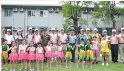
植樹活動現場貴賓與表演小朋友一起合影留念。