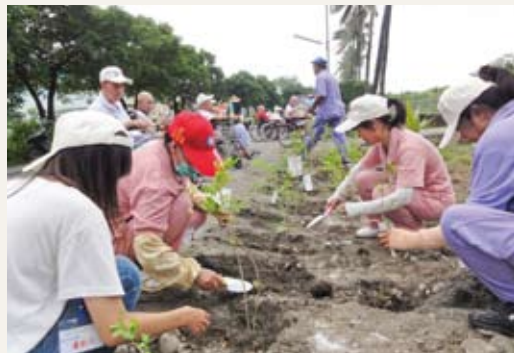
榮家榮民、志工及內埔鄉社區居民們共同種下象徵希望的樹。