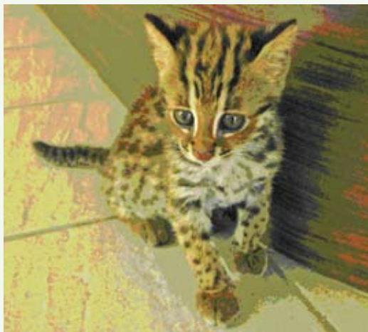
台灣重要的珍貴野生動物—小石虎。

練，希望早日將牠送回到山林。石虎是台灣重要的珍貴野生動物，需要大家的關心與愛護，若有發現需要救傷的石虎，可立即就近連絡當地政府或林務局相關單位，千萬不要帶回家收養，飼養保育類野生動物會違反野生動物法相關規定，一經查獲，將面臨重罰。(新竹林區管理處 余建勳)