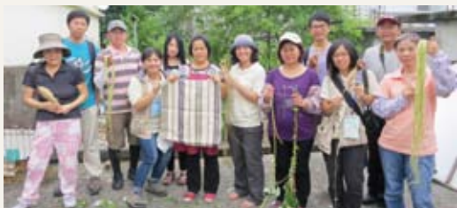
芋麻傳統技能製作體驗。

的實作與案例討論，協助社區發展在地型的環境教育方案，促成地區保育教育工作之落實，提供南澳社區未來環境教育方案發展上的各種建議。(員山生態教育館 曹瀾)