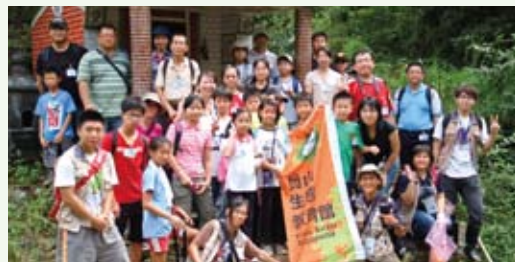
「山海老傳奇」活動成功。(攝影／員山生態教育館 曹瀟)

中，老漁夫親身示範，讓大小朋友們一同化身漁夫，動手編織漁網、染備漁網，踏上充滿歷史氣氛的石空古道尋找製作染劑的原料。透過動手操作、實地探訪、認識民族植物以及學習漁夫百年來運用山上生態資源的生活智慧，一起體會漁夫、山林及海洋之間的緊密關係！（員山生態教育館 曹瀟）