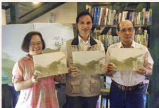
「世紀之森」新書發表會。

繁盛的生態景緻，以文字與圖片串聯，自原始林業時期至現今的森林生態系經營時期，娓娓道來蘭陽林業的發展，帶領讀者穿梭於時空之中，並藉其發展，記錄蘭陽百年歷史。希望此書之付梓，能讓民眾更了解蘭陽森林文化，並樂於探索與參與。(羅東林區管理處 陳冠璋)