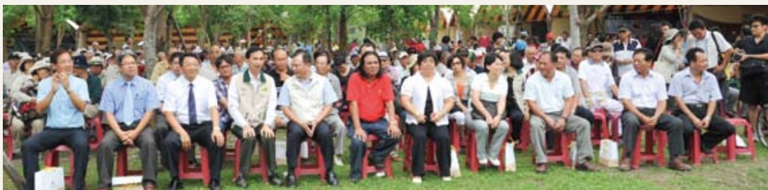
老員工及眷屬歡樂回娘家。