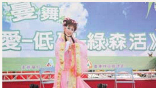
運用歌仔戲宣傳小花蔓澤蘭的防治工作，演員口白順暢而押韻，十分逗趣且令人印象深刻，宣傳效果十足。

望大家把握時間，清除住家四周空地或果園中的小花蔓澤蘭時，務必連根拔起，放在水泥地或柏油路上曬乾，切勿放在泥土地上，以免再度發根蔓生。(台東林區管理處 林素夷)