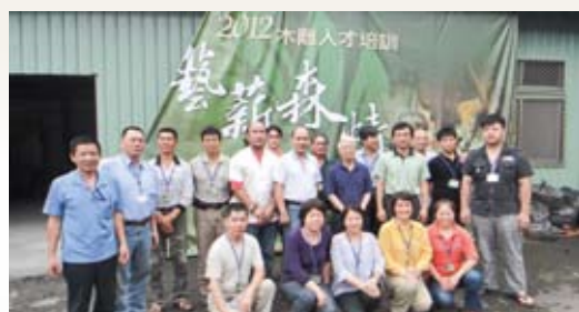
東勢林區管理處2012年木雕人才培訓進階班開課紀念照。(攝影／東勢林區管理處 彭馨慧)

木雕藝術暨林業文化園區」目前正朝向木雕公園規劃，為充分利用漂流木資源，使大自然給予人們的重要資源再利用創作新價值，並傳承木雕技術，儲備木雕人才；且鑑於木雕技藝非一蹴可及，除初級班外，亦辦理進階課程，俾技藝之傳承及養成。該成果展除展示學員們木雕作品，亦吸引對藝術有興趣之民眾參觀。(東勢林區管理處 彭馨慧)