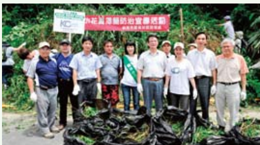
農委會副主委胡興華帶領清除小花蔓澤蘭。(攝影／羅東林區管理處 張怡佩)

澤蘭危害與防治的專業解說及有獎徵答，最後由農委會副主委胡興華及羅東處處長林鴻忠的共同帶領下，讓300人一起消滅生態殺手—小花蔓澤蘭。(羅東林區管理處 張怡佩)