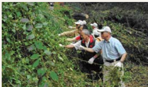
立法委員徐耀昌、立法委員陳超明、苗栗縣縣長劉政鴻及林務局局長李桃生等人參與除蔓活動。

林務局、新竹林區管理處、苗栗縣政府及苗栗市公所101年9月1日共同在苗栗市貓裏山公園舉辦小花蔓澤蘭防治宣導活動，短短半天的時間就拔除了2,635公斤的小花蔓澤蘭，成果相當豐碩。在今天的活動中，立法委員徐耀昌、陳超明、苗栗縣縣長劉政鴻及林務局局長李桃生等人都親自到場關心，給予參加的民眾及工作人員莫大的鼓勵，也讓大家看到政府不遺餘力推動防除外來入侵種「綠癌」的決心。活動現場特別安排自然手作小花蔓澤蘭植物染DIY，透過植物體再利用，教導民眾如何製作美麗的布巾飾品，藉此活動將防治觀念深植心中，寓環保於樂趣中。(新竹林區管理處 吳芳滿)