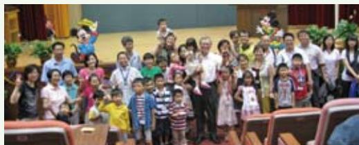
林務局局長李桃生與同仁及同仁眷屬合影。(攝影／林務局 鄭國隆)

配合「行政院及地方各級機關規劃辦理親子活動實施計畫」，101年8月9日由林務局局長李桃生親自揭開101年度「大手牽小手－員工親子快樂營」序幕，活動開始，他歡迎大小朋友藉參加本活動瞭解並體會爸爸、媽媽平日上班的情形及工作的辛勞，並和參與活動的員工眷屬合影留念。本活動上午時段除開放自由參觀工作環境外，期間並安排播放影片「波普先生的企鵝」，及安排豐盛午餐供同仁及眷屬享用；下午則前往「長榮海事博物館」參觀，了解船舶的歷史、藝術與科學，讓平日忙碌於工作的同仁放鬆心情，提升親職職能，增進親子感情；活動有員工及眷屬80人參加，平安盡興而歸，活動圓滿成功。（林務局 鄭國隆）