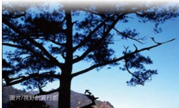
圖片／視野創異行銷