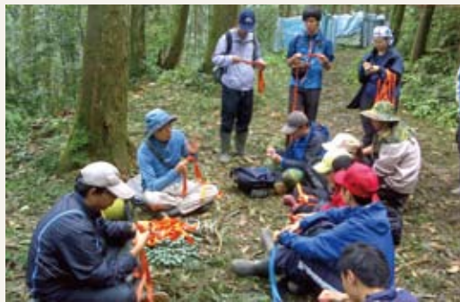
野外繩結技術訓練。(攝影／屏東林區管理處 廖國棟)

林務工作者一起交流，在資源豐富之環境內實地學習，體驗真實的野外求生及保育經驗。(屏東林區管理處 廖國棟)