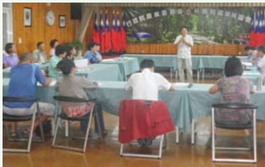
解說口試測驗。

為推展羅東林業文化園區解說及服務工作，林務局羅東林區管理處101年6月公告辦理羅東林業文化園區第4期國家森林解說宣導志工招募作業，報名者經過書面初審、面試複審、課程培訓等，終於在101年9月4日共18人通過筆試及口試測驗等層層關卡，獲晉級資格成為實習志工。期許他們接續能通過實地見習考驗，正式成為園區解說宣導志工一員。(羅東林區管理處 李盈勳)