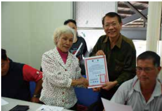
▲臺東林管處與海端鄉公所共同成立的「原住民族部落之自然保育與生態旅遊諮詢委員會」，在海端鄉公所召開第1次會議，張處長頒發委員證書給諮詢委員。（攝影／臺東林區管理處 楊凱琳）

4月9日下午，臺東林管處與海端鄉公所共同成立的「原住民族部落之自然保育與生態旅遊諮詢委員會」，針對協助輔導各部落從事高山協作之措工、嚮導與廚工等，成立組織團體，設立管理規範，並統籌運作及訂定所成立組織團體的工作（服務）項目等議題，在海端鄉公所召開第1次「農委會林務局臺東林區管理處與臺東縣海端鄉原住民族部落之自然保育與生態旅遊諮詢委員會」。（臺東林區管理處林素夷）