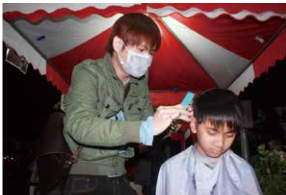
▲贈苗會場還有華山基金會的義剪活動，雖然下著濛濛細雨，但仍募得近800張發票及2萬3千餘元的義賣金額，收獲豐碩。。

場，特選民眾喜歡、有優雅香味的、開花漂亮引人的樹種，如朱槿、茉莉花、月橘、樹蘭、日本女貞、紫薇等，合計1,500株苗木讓民眾換領；現場還有華山基金會的義剪及筋絡按摩，及哈拿希望之家的童衣義賣等公益攤位。雖然下著濛濛細雨，但現場公益團體在短短3小時內，仍募得近800張發票及2萬3千餘元義賣金額，收獲豐碩。（臺東林區管理處林素夷）