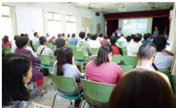
▲汛期防災措施與勞工安全研習會（攝影／嘉義林區管理處 沈宜慶）

鑑於本（104）年汛期將屆，且近年來極端氣候暴雨頻繁常引發山區複合型災害發生，林務局嘉義林區管理處特別於 104 年 4 月 16 日邀集轄區臺南市、嘉義縣、雲林縣鄉（區）公所及村（里）長、轄內山區部落代表及各承攬嘉義林管處工程之設計監造單位及施工廠商，參與汛期防災措施與勞工安全研習會，期透過此次研習，提醒大家要居安思危，並加強山區居民自主防災能力，以避免土石流災害發生造成生命財產損失及維護工程施工安全。（嘉義林區管理處 沈宜慶）