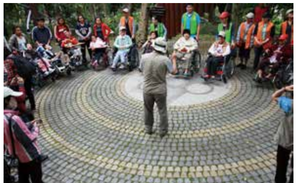
▲解說志工生動的介紹著園中的草木，迦南的老人家聽的津津有味、頻頻點頭；救星的小朋友們雖然不說話，但眼神專注而發亮，顯然感受到森林的療癒魔力，也很開心。

4月22日是世界地球日，為了讓身心不便的輪椅族，也能親近綠意愛地球，臺東林管處特別邀請迦南銀髮生活福祉中心，及救星教養院的住民，前往體驗甫獲內政部103年度友善建築獎的園區無障礙設施，同時，也邀請媒體記者「換個位子」玩知本，坐在輪椅上遊園，體會輪椅族的眼界、親自感受「輪轉知本」的心情！（臺東林區管理處 林素夷）