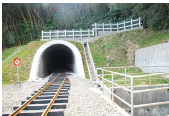
▲多林隧道鋪軌