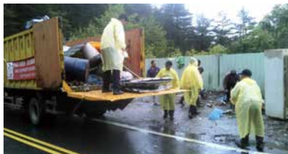
▲大禹嶺地區路旁雜物、廢棄物清理