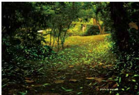
▲圖2.池南自然教育中心螢火蟲大爆發時期。