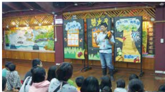
▲圖1.環境教育教師透過紙偶與海報介紹螢火蟲的生活史。（攝影／花蓮林區管理處 陳美彤）

池南自然教育中心為響應世界地球日，在4月18、19日辦理兩梯次「熄燈一小時，螢光來照路～拜訪夜光家族」主題活動，帶著親子大眾們在這兩夜晚熄燈一小時，走出戶外，來到池南國家森林遊樂區欣賞點點螢光，認識這些夜晚發光的小精靈。活動當天，自然教育中心的環境教育教師利用簡報與影片，詳細介紹常見的螢火蟲種類，並且傳達森林棲地與濕地環境保育的重要性。而夜晚的重頭戲－夜間觀察，天公也十分作美，讓每位參與的民眾都能看見森林裡閃爍的美麗螢光。（花蓮林區管理處 陳美彤）