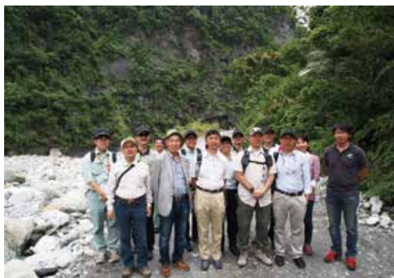
▲臺日雙方專家學者參訪花蓮縣「壽豐溪一號防砂壩」工程治理成效情形（攝影／花蓮林區管理處 黎璧瑞）

林務局花蓮林區管理處將長期監測分析花蓮縣壽豐溪集水區土砂運移之經驗成果，於104年5月27日與來自日本之專家學者共同針對「壽豐溪」及位於日本本州富山縣內擁有長達70年之久的土砂監測案例「常願寺川」，提出長期治理經驗交流，並至花蓮縣「壽豐溪一號防砂壩」工程現址實地參訪，分享相關大型災害整體治理經驗及實務與學術交流。（花蓮林區管理處 黎璧瑞）