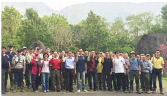
▲檢、警、林15機關於阿里山鄉豐山地區聯合擴大查緝掃蕩大會合