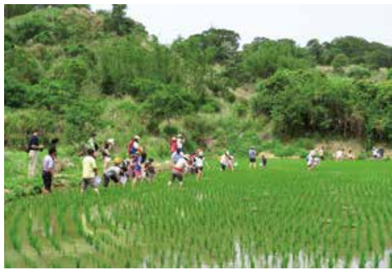
▲參與種米護石虎活動的民眾，個個捲起褲管下田體驗娑草的樂趣