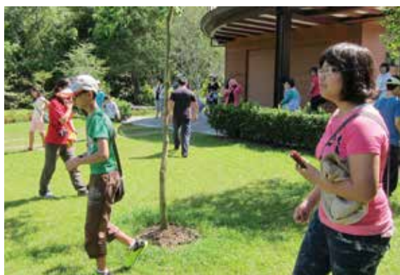
▲「自然夠有趣」活動

自閉兒又稱星星兒，因溝通方式與一般人不同，需要外界的理解與包容，才能讓他們的学习之路更順利。林務局嘉義林區管理處觸口自然教育中心於104年4月18日辦理特別企劃「自然夠有趣」活動，邀請致力於自閉兒教育及技能訓練的嘉義市關懷自閉症協會，帶領所協助的星星兒及家長一同走進觸口，透過生態遊戲及園區導覽等活動，引導星星兒利用感官認識大自然，同時加強他們的專注力與觀察力；無論是聞到桂花的淡淡清香、聽見五色鳥敲木魚般的鳴叫聲或觸摸九芎光滑的樹皮，對星星兒來說都是新奇的體驗。儘管較不擅於用言語表達，但從星星兒的自然拼貼作品中，可以看見他們用自己的方式，表現出心中的自然印象及活動後的心得感想，也為這趟在自然環境中的快樂學習留下美好回憶。（嘉義林區管理處 陳淑芳）