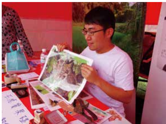
▲透過生動的圖片及小遊戲的方式，讓民眾更加認識石虎這個神秘的生物