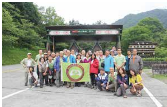
▲屏東處志工踏訪太平山森林步道之美

林務局為培育國家森林志工，提供民眾免費申請所轄國家森林遊樂區解說導覽服務，長期規劃專業訓練課程及參訪研習，深化志工多元性解說知能。屏東林區管理處於5月21~23日走入羅東林業文化園區，見證了林業發展的足跡。國家森林志工經由本次研習，為自然資源及林業歷史解說的本職學能與技巧充飽電，將提昇多元知能的解說服務品質與內涵。（屏東林區管理處 陳以臻）