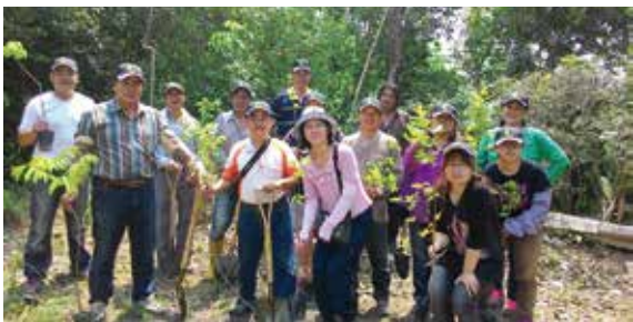
▲臺南市澄山社區綠美化