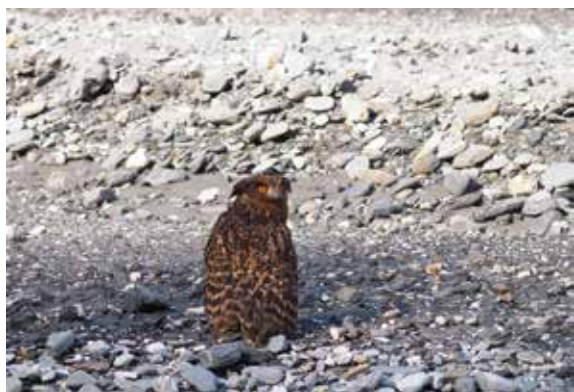
▲野放時，黃魚鴉從紙箱衝出，先飛越溪流到對岸河床停下，張著大眼靈活來回轉著頭張望了一會，然後才振翅沿著溪谷往上游飛離。（攝影／臺東林區管理處 陳宗駿）

眼定睛注視靠近的人，處於警戒狀態，為避免造成黃魚鴉的緊迫，加上 2-5 月為黃魚鴉育雛期，因此評估後以儘速野放為原則，在村民們通力合作下將黃魚鴉暫移至紙箱，以避免驚嚇干擾，隨後運至附近人為干擾較少的深山溪流野放。（臺東林區管理處 陳宗駿）