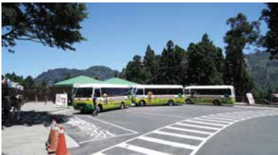
▲阿里山國家森林遊樂區遊園車候車總站（攝影／嘉義林區管理處 黃玟璇）

林務局嘉義林區管理處阿里山國家森林遊樂區為提供遊客更安全且舒適的候車場域，自 104 年 5 月 15 日起，裁撤原位於區內大型車停車場之遊園車候車場域，遷移至候車總站。此後搭乘遊覽車或步行入園之遊客，將可至鄰近之候車總站候車，減少電動中巴及遊客和入園遊覽車動線衝突之情形發生。本場域之遷移除有效解決原大型車候車場域常見之電動中巴及遊客和入園遊覽車動線衝突之情形，更提供遊客舒暢、清新之視覺及嗅覺感受，免除遊客於候車時吸入遊覽車輛廢氣。（嘉義林區管理處 黃玟璇）