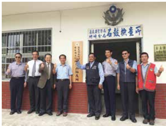
▲為打擊山老鼠遏止盜伐成立豐山駐在所。

林務局嘉義林區管理處為遏阻盜伐、有效運用人力，於5月1日將豐山、來吉、草嶺等巡護人力集中於嘉義縣阿里山鄉豐山村成立駐在所。除嘉義林管處人員常駐外，並有保七總隊第七大隊嘉義分隊每日派警員排班進駐，另嘉義縣警察局竹崎分局增派警力進駐太和派出所及來吉派出所各一人，24小時就近控管林班狀況，齊心協力共同打擊山老鼠。（嘉義林區管理處 黃玟璇）