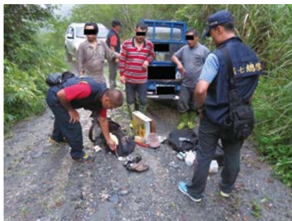
▲ 關山工作站及保七總隊第九大隊臺東分隊員警，無畏風雨，合力逮獲涉嫌違反森林法竊取森林副產物牛樟菇嫌犯 3 名，並起出牛樟菇 346.1 公克。

臺東林管處關山工作站及保七總隊第九大隊臺東分隊員警，無畏風雨，合力逮獲涉嫌違反森林法竊取森林副產物牛樟菇嫌犯 3 名，並起出牛樟菇 346.1 公克。曾姓嫌犯等 3 人近日來為避開查緝，在山區以修繕水管的名義，利用下雨天進入國有林班地內盜採森林副產物－牛樟菇。19 日上午警方巡邏時，發現可疑汽車停在加樂溪河床邊產業道路，研判應為盜採森林副產物的山老鼠所使用的交通工具，遂由大隊長廖正成指揮臺東分隊員警，於產業道路埋伏，終於該日 18 時許攔下由謝嫌所駕駛的小貨車，並在同行的曾嫌身上起出牛樟菇總重 346.1 公克，嫌犯坦承不諱，當場人贓俱獲。案經保七總隊第九大隊臺東分隊偵詢後，於 20 日依違反森林法移送臺東地方法院檢察署偵辦。（保七總隊第九大隊臺東分隊 王廷瑜）