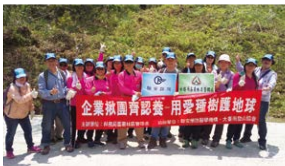
▲ 企業認養護持大地（攝影／嘉義林區管理處 陳虹余）

嘉義林管處為響應世界地球日活動，今日以從山巔到海角的關懷地球方式，分別在鰲鼓濕地森林園區辦理「淨化濕地大作戰－移除入侵外來種銀合歡」活動，及在大埔事業區第88林班辦理「企業揪團齊認養－用愛種樹護地球」活動，藉由不同的活動方式，提醒大家共同為保護地球盡一份心力，讓大地得以回歸自然，地球永續。（嘉義林區管理處 陳虹余）