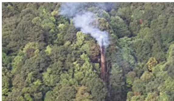
▲ 落雷在巒大事業區第49林班引發森林火災

5 月 11 日下午 6 時在南投縣信義鄉巒大事業區第 49 林班發生罕見的一棵紅檜枯立木引發遭雷擊事件，因地處偏遠高山，人力無法立即到達，南投林管處採取陸空聯合滅火機制，地面救火人力採重裝步行，直升機由濁水溪取水空中滅火。林管處丹大工作站地面人員 13 日上午 8 時到達起火點，該枯木上半段約 15 公尺已燒毀斷裂掉落地面，尚有零星冒煙，至於尚留存之枯木亦尚有餘煙，救火隊以鏈鋸將尚有火種枯木切開，用砍刀將火種刮除，再以土壤覆蓋，最後將枯木周圍燃料清除，以免復燃，直至 12 時現場處理完畢撤離現場。(南投林區管理處 簡盈宜)