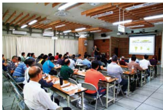
▲南投林管處辦理「105年度防汛教育訓練班」教育訓練

當日下午則邀集臺中、南投、彰化及雲林縣（市）政府、水土保持局南投、臺中分局、水利署第三、四河川局、臺灣大學及中興大學實驗林管理處及林管處各災害緊急處理與維護工程開口契約廠商及各工作站等相關機關、廠商及單位人員召開「105 年度防汛聯繫會議」，希望建立各機關及單位間災害應變運作、聯繫、協調及支援機制，俾能在災害應變分秒必爭的情形下，切實做好機關間橫向聯繫，以提昇政府機關整體災害應變及防救災能力。（南投林區管理處 簡盈宜）