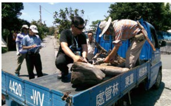
▲ 現場工作人員進行檢尺、辨別樹種之情形。 （攝影／臺東林區管理處 王智弘）

臺東林管處成功工作站在馬武溪出海口北側沙灘辦理漂流木臨時檢查站演練，保七總隊第九大隊臺東分隊員警也參與演練，協助攔檢，演練中由工作站同仁扮演民眾，從民眾的角度出發，並以各種突發狀況來考驗檢查站同仁的應變能力。經過不同情境考驗，同仁均能熟悉漂流木判識、檢尺及有無國公有註記之檢查流程，提昇為民眾辦理漂流木登記服務之效能。（臺東林區管理處 王智弘）