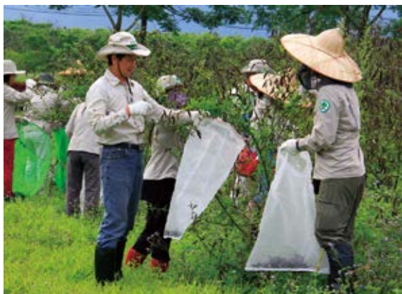
▲林後四林平地森林園區內採收樹豆