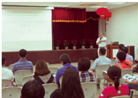
▲ 與會人員聚精會神聆聽講習 （攝影／屏東林區管理處 蘇家立）

汛期將來臨，屏東林管處為增強防災能力，於 27 日舉辦「防災橫向聯繫工作會報及防減災應變」講習，特邀請成大地球科學系林教授慶偉及成大防災中心臧副主任運忠當授課講師，參與講習人員除屏東林區管理處員工、工程設計監造公司及施工廠商外，並邀請相關政府機關單位如經濟部水利署第七河川局、高雄市桃源區公所及屏東縣春日鄉公所等共通參與，共有 50 人參加講習。期能透過本次講習，提升各相關機關參加講習人員災害處理能力，加強機關間橫向聯繫機制，迅速處理災害，減少生命財產之損失。（屏東林區管理處 蘇家立）