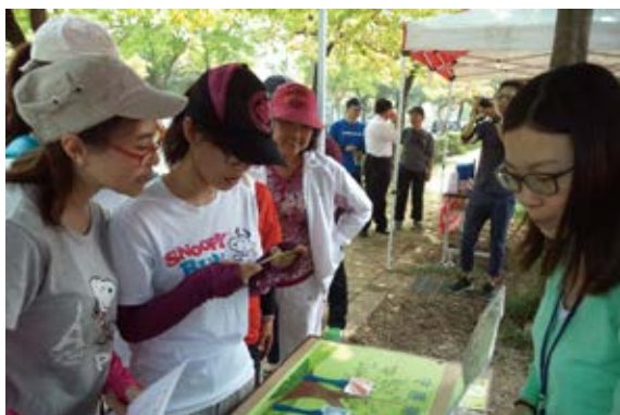
▲ 民眾參與廉政有獎徵答活動 （攝影／屏東林區管理處 黃聖宏）

屏東林管處為響應當今政府之廉能政策及世界環保潮流植樹護林愛地球，30日在屏東市台糖壘球場，與臺灣屏東地方法院共同舉辦「廉政宣導暨壘球盃活動」。宣導活動包含設置廉政宣導攤位、簽署守護廉潔樹、有獎徵答及臉書打卡按讚等闖關遊戲，完成闖關活動之民眾可獲贈樹苗1株或精美紀念品1份，透過活潑、寓教於樂的方式，促使民眾共同加入反貪倡廉行列，提昇政府清廉形象。（屏東林區管理處 黃聖宏）