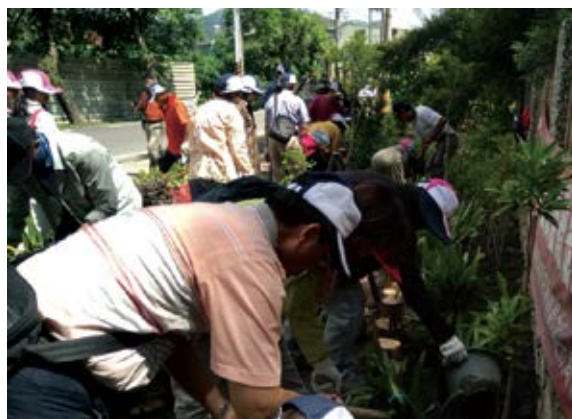
▲ 民眾實際操作練習植樹規劃設計與栽植技巧 (攝影／屏東林區管理處 黃淑清)

樹綠美化宣導研習活動。本次活動邀請高雄、屏東各社區居民參與，除宣導綠美化申請相關資訊，並示範植樹規劃、實作課程，且讓民眾實際動手操作，由實作過程體驗綠美化植栽技巧與撫育管理須注意的事項。(屏東林區管理處 黃淑清) 🌱