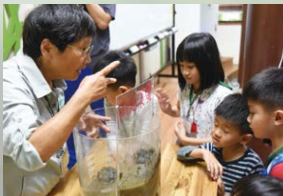
▲ 認識並欣賞臺灣南海溪蟹

在觸口自然教育中心園區生態水道旁，住著一群披著盔甲的神祕嬌客－臺灣南海溪蟹。為使民眾進一步認識蟹類生態，嘉義林管處觸口自然教育中心於5月21日辦理105年第一梯次親子主題活動－美麗的「蟹」逅，活動中運用國立海洋生物博物館提供之寄居蟹及椰子蟹模型，除介紹這些甲殼類構造外，並藉由模型探討牠們生存面臨的環境議題，課程中也播映以觸口現地臺灣南海溪蟹為拍攝主角，並獲得美國休士頓國際影展金牌獎的《臺灣南海溪蟹的故事》影片，活動過程動靜穿插，內容高潮迭起，民眾得以一窺臺灣南海溪蟹的生活大小事，也瞭解社會環境變遷及人類生活對蟹類生存的影響，讓來訪親子印象深刻，深深省思如何幫助這群橫行霸道的小生物與人類共生。（嘉義林區管理處 陳淑芳）