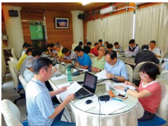
▲ 南投林區管理處召開「漂流木清理分工與應變處理會議」，確認各單位之權責分工、標準作業程序、緊急聯絡方式及後續應變處理，以提昇防救災能力

南投林管處於 105 年 4 月 27 日邀集經濟部水利署第三、四、五河川局、中區水資源局、台電公司萬大、明潭、大觀發電廠、南投縣政府、彰化縣政府、雲林縣政府、內政部警政署保七總隊第六大隊、臺灣大學、中興大學實驗林管理處與南投林管處各工作站等機關及單位，召開「漂流木清理分工與應變處理會議」，希望能達成各機關之橫向溝通與協調，確認各單位之權責分工、標準作業程序、緊急聯絡方式及後續應變處理，以提昇防救災能力。（南投林區管理處 簡盈宜）