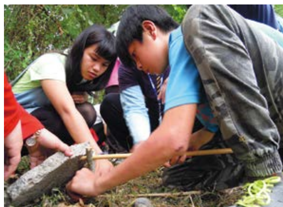
▲ 生態旅遊之最優遊客體驗、學習山林智慧－追蹤獸徑（太魯閣族紅葉部落）

乍暖還寒的春末初夏，樹梢悄悄萌出點點新綠，而轄屬花蓮林管處的國家森林遊樂區、平地森林園區，到了夜裡更是螢光點點、蛙鳴熱鬧。爰此，花蓮林管處繼叫好又叫座的生態旅遊體驗活動系列一「平地森林園區賞螢趣」之後，於 105 年 4 月 16、17 日精心策劃系列二「森林追蹤 follow me」，邀請民眾一同見識林業古今風貌、徜徉充滿芬多精、負離子的森林與瀑布，並且探訪山林部落傳說、體驗太魯閣族獵人文化、邁向玉里野生動物保護區的前哨站－瑞穗生態教育館！遊程中不僅感受到豐富的自然資源，遊客們也與當地居民互動熱絡，精采體驗了與山林共生的智慧，還透由享用當令美食、自備水杯等措施，活絡在地低碳產業、培養綠色生活習慣。（花蓮林區管理處 陳佳玫）