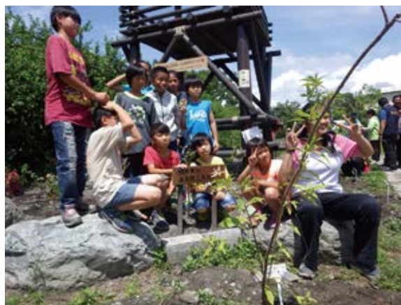
▲ 伊灣部落在臺東市大康樂聚會所舉行社區植樹綠美化及贈苗活動，同時也邀請社區內的救星教養院、康樂國小、臺東專科學校等師生前來參與。 (攝影/臺東林區管理處 林依潔)

臺東市伊灣部落在臺東市大康樂聚會所舉行社區植樹綠美化及贈苗活動，活動由該部落文化協進會籌劃，在溫馨的 5 月間，為慶祝母親節並結合林務局推動的社區植樹綠美化計畫，舉辦大型活動，鄰近的康樂里、豐樂里及永樂里的阿美族人，及來賓等合計約 200 餘人熱情參與，臺東市長張國洲、前縣長陳建年、立法委員廖國棟、縣政府代表及臺東縣議員林秀信、方賢仁、林琮翰等也撥冗前來參與盛會。臺東林管處知本工作站主任吳昌祐表示，部落聚會所一直是原住民族部落及夥伴舉辦祭儀或慶典的重要場所，更是凝聚部落及社區意識的地方，伊灣部落文化協進會特別邀請臺東專科學校景觀園藝科同學，在沈鈺婷老師指導下，設計聚會所植樹及綠美化活動，使部落整體環境增色不少。(臺東林區管理處 林依潔)