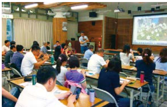
▲ 講師講授智慧型手機可供拍照使用之設定

南投林管處為增加新聞素材之多樣性，進而促進新聞稿之曝光率，於 5 月 6 日上午在林管處舉行「新聞影片錄影研習」，邀請台視及三立電視台駐地記者為林管處同仁上課，讓同仁可以利用手邊的智慧型手機收集事宜發布之新聞素材，共有管理處及工作站數十人參與。（南投林區管理處 簡盈宜）