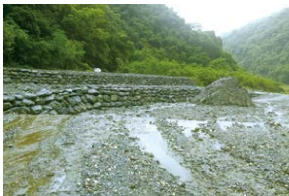
▲趕在颱風季節前，針對加鹿溪上游河段掏空區段加強基礎深度並新建砌石護岸及河道整理以控制溪流流心。