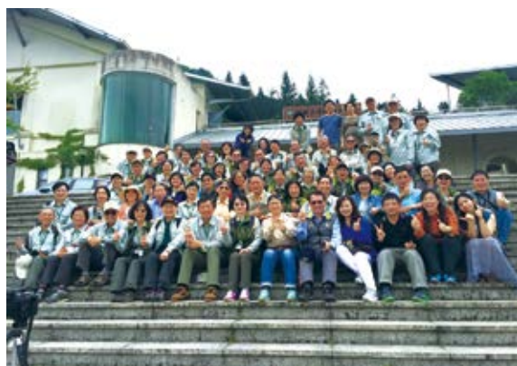
▲ 國家森林解說志工隊暨新竹林管處同仁團體合照

新竹林管處國家森林解說志工隊創立於民國85年，至今已屆20年，為持續行銷森林文化，鼓勵民眾親近自然，並提升團隊凝聚力，在4月30日於東眼山國家森林遊樂區辦理「珍愛20·森情永續」開幕典禮，分別舉行霞雲國小歌舞表演、志工森情攝影回顧、2015年臺灣野望國際自然影展影片播映、闖關活動及定向運動等，並感謝志工20年來的熱情解說志願服務協助。（新竹林區管理處 湯偉志）