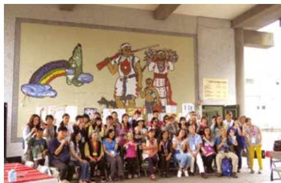
▲ 生態旅遊之最優遊客體驗、學習山林智慧、善用民俗植物－薏苡串珠串珠DIY（太魯閣族銅門部落）