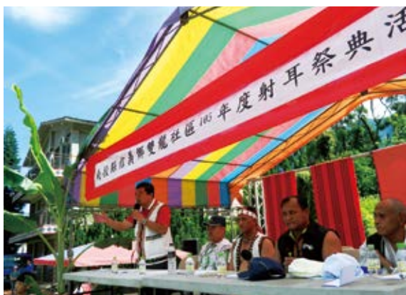
▲ 南投林區管理處丹大工作主任獲邀上台致詞