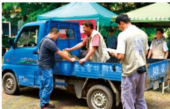
▲ 南投林區管理處辦理「漂流木設置臨時林產物檢查站狀況演練」

南投林區管理處 5 月 23 日偕同南投縣政府及保七總隊第六大隊於轄內水里工作站辦理「漂流木設置臨時林產物檢查站狀況演練」，並針對公告自由撿拾期間，民眾撿拾漂流木可能發生之三種情境：「查有國、公有記號烙印，且願意歸還者」、「查無國、公有記號烙印者」及「查有國、公有記號烙印，不願意歸還，且有鋸切痕跡者」進行模擬演練，透過實際之操作，加深同仁應變能力及機關之合作。（南投林區管理處 簡盈宜）