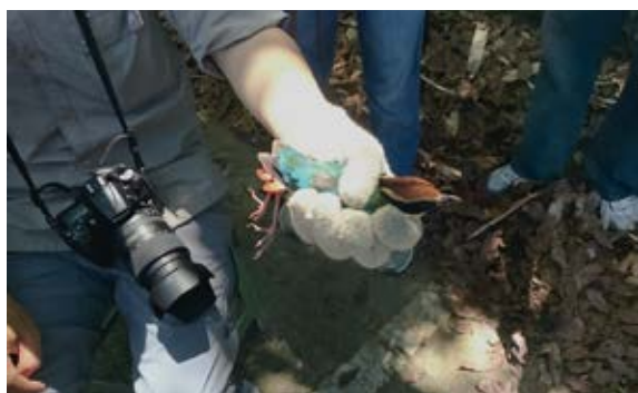
▲ 遭捕獲之八色鳥