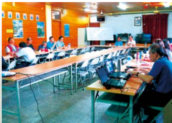
▲南投林管處假水里工作站辦理第5次原住民議題座談會，信義地區重要意見領袖皆參與座談。

南投林管處 4 月 6 日假水里工作站辦理第 5 次原住民議題座談會，座談會由處長張岱親自主持，出席單位包括：全文盛委員、南投縣信義鄉公所、南投縣信義鄉民代表會、信義鄉各村村長、達瑪巒原住民重生協會、社團法人臺灣生態旅遊協會及業務相關課室等。會中首先由「社團法人臺灣生態旅遊協會」郭育任副理事長報告「丹大地區暨鄰近四村落（潭南、雙龍、地利及人和）生態旅遊培力發展輔導計畫」辦理情形，說明未來之施行方向及內容都將與部落共同討論達成共識後再行決定，並以四村落整體利益為訴求，力求符合公平正義原則。與會原住民除感謝林管處在丹大地區生態旅遊上所做的努力外，也認同未來努力方向。（南投林區管理處 廖吟梅）