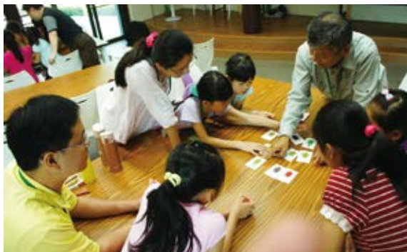
▲利用觸口好Bug桌遊認識昆蟲特徵

嘉義林管處觸口自然教育中心4月16日辦理「歡喜學習樂桌遊」主題活動，吸引親子攜手至中心參與這不插電的遊戲，並藉此課程活動內容與自然環境連結，度過快樂學習又環保愛地球的週末上午時光。觸口自然教育中心運用與自然資源及環境議題相關的桌遊，透過活潑生動的課程設計，讓孩子們與家長除享受「一起玩」的樂趣，亦培養遵守遊戲規則、樂於接受勝負結果的正向態度，並在環境教育教師的引導下，從桌遊中延伸思考自然資源與環境議題，了解環境變化及現況，激發環境保護行動。(嘉義林區管理處 陳淑芳)