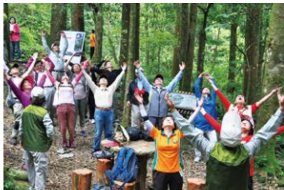
▲ 闖關活動—森深呼吸