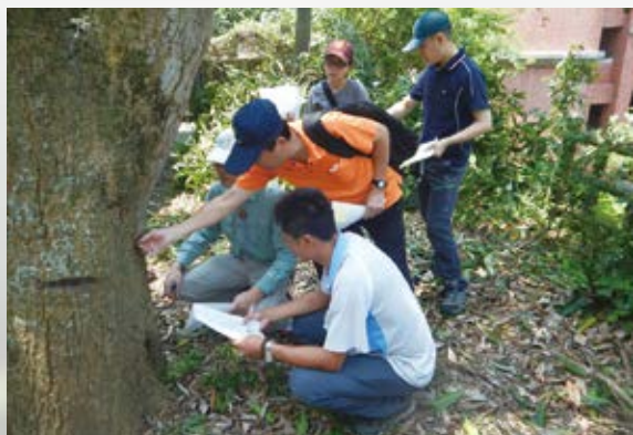
▲ 新竹林管處同仁協助林木風險診斷評估