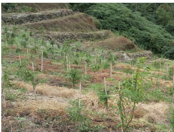
▲大甲溪75林班濫墾菜園收回造林

4. 屬擅設工作物者：除地面上之建物須完全拆除外，地面如有水泥鋪面亦應一併清除，必要時予以客土再進行栽植工作。