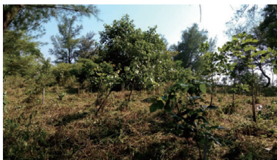
▲金門排雷區造林地撫育刈草後現況