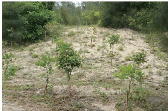
▲海岸林空隙地造林