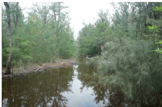
▲開溝築堤營造海岸林