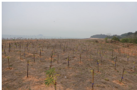
▲金門排雷後新植造林地

目前海岸排雷區在林務局及金門林務所的合力下，100 至 105 年累積營造 127 餘公頃海岸造林，雷區造林除了能夠達到防風定沙等眾多森林公益功能外，林木每年持續進行碳吸存量，這對於達成低碳目標有著極大的貢獻，最終期盼金門能夠成為森林蓊鬱的無雷生態島嶼。