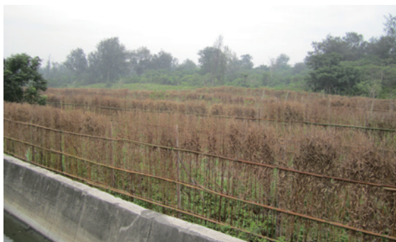
▲海岸河岸造林防風設施—防風籬

季風盛行時節，對於強風及飛砂的抑制更為顯著；然而林地早期因民眾環境保護觀念較薄弱，林地林木時常遭受破壞，例如：傾倒垃圾或排放養殖廢水、火災等情事，都影響到林地林木生長，故除積極清除林地廢棄物，維護林地環境，並倡導「林業走出去，民眾走進來」的政策理念，讓當地居民認識且瞭解林業對於當地環境的重要性，縮短林務單位與居民的距離，讓居民就近協助林地、林木保護工作。