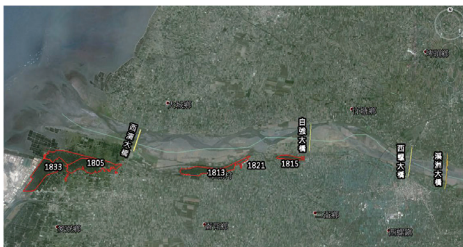
▲濁水河流域彰化縣、雲林縣示意圖暨保安林位置圖