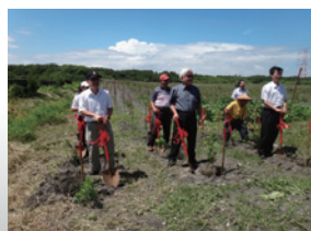
▲濁水溪揚塵造林成果記者會