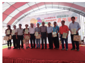
▲2016年社區植樹綠美化成果回顧展望嘉年華會－雲林場