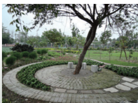
▲雲林縣二崙鄉崙西社區植樹綠美化