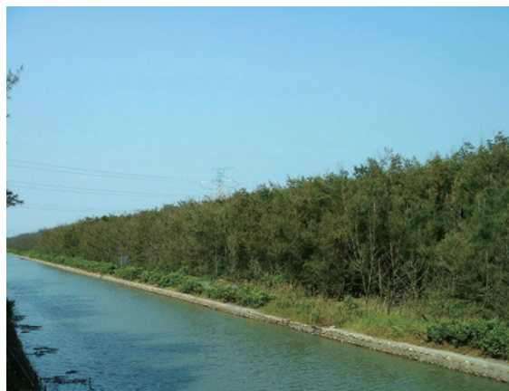
▲雲林縣麥寮鄉第1833號衛生保健保安飛砂防止保安林