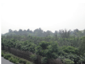
▲雲林縣二崙鄉港後段復育造林地