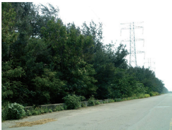
▲雲林縣崙背鄉第1813號保安林