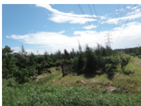
▲雲林縣崙背鄉貓兒干段復育造林地