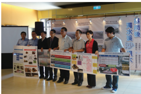
▲揚塵防制宣導聯合記者會