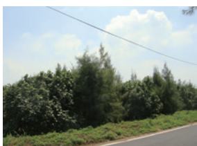
▲雲林縣麥寮鄉橋頭段、雷厝段復育造林地