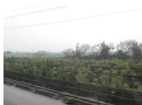
▲雲林縣二崙鄉大庄段復育造林地