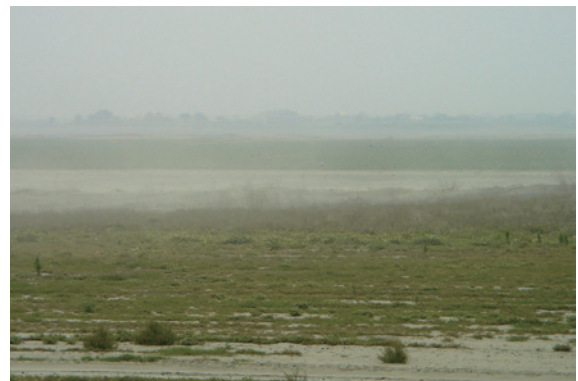
▲揚塵好發期間，塵土飛揚。

在農耕施作過程較缺乏有效管理，且耕作過程並未進行抑制揚塵相關措施，尤其在翻土後長時間未進行覆草等抑制揚塵措施，又河床上翻土期間恰好是東北季風盛行季節，造成大量揚塵，上述氣候變遷及人為等種種因素，使得每年 10 月至翌年 4 月為濁水溪河川揚塵好發時期，特別是位在雲林縣二崙鄉自強大橋以西經西濱大橋至河川出海口區域易發生河川揚塵，嚴重影響濁水溪南岸之雲林縣西螺鎮、二崙鄉、崙背鄉及麥寮鄉等河川沿岸鄉鎮，也造成濁水溪鄰近河川地區居民生活上、健康上的不便與影響，有鑑於濁水溪揚塵問題日趨嚴重，政府各單位也刻不容緩進行各項揚塵改善措施，期使河川揚塵危害降低，民眾生活品質得以改善。