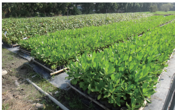
▲苗木培育—草海桐、黃槿