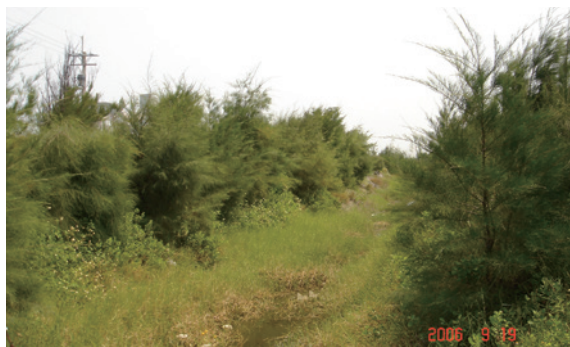
▲林地地勢低窪易積水，利用開溝築堤栽植林木。