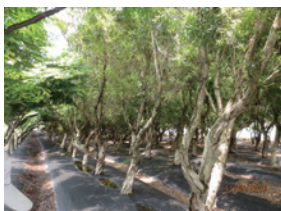
▲雲林縣崙背鄉平地造林