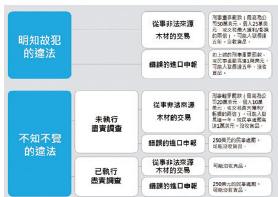
▲圖 1、雷斯法案修正案針對非法交易或錯誤申報的懲處（EIA, 2009）

當相關企業或個人未達到申報要求或應盡的注意責任，修正案對於不同的犯法行為將執行不同的處罰措施。處分措施可區分成民事行政處罰與刑事處罰，對於未確實履行「善盡應盡之責」的當事人將處以民事罰款，處罰金額將依照違法行為、情形、程度、嚴重性、當事人支付能力以及法庭其他考量來酌情處罰，罰款最高為 1 萬美元；假使是出於不知情而發生的標記錯誤或違反申報要求，但其中不包含明知故犯，則處以 250 美元罰鍰。由有權制裁違法的機構對當事人發布違法通知並評定處罰金額，若當事人對於處罰判決有異議，該機構必須提出證據。另外，一旦違反雷斯法案而進口非法木材或其製品（也包含非法野生動植物或魚類）入美國市場，不論當事人是否知情違法，政府有權扣押該產品，同時政府必須提出該產品違法國內或國外法律規章之證明。