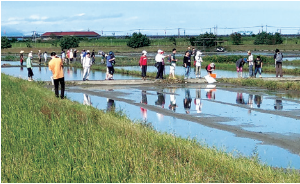
圖4、民眾參與新南田區友善農田棲地營造工作。