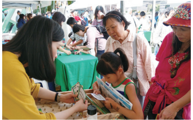
圖7、濕地保育市集之里山動物有獎徵答活動，吸引許多小朋友參加。

國土生態綠網計畫除了串連生物的棲地網絡，亦希望串連起人的網絡。林務局呼應國際生物多樣性公約所提倡的「國際里山倡議夥伴關係網絡（IPSI）」之運作架構，自2014年開始與東華大學聯合推動「臺灣里山倡議夥伴關係網絡（Taiwan Partnership for the Satoyama Initiative, TPSI）」的全國性策略架構，近二年來陸續邀請志於實踐「里山倡議」目標和作法的實務工作者和相關組織，參加臺灣北、中、南、東各區實地踏查及交流工作坊，分享各自推動里山行動及友善生產的經驗，促進在地實務工作者、社區與部落組織、民間機構、綠色企業與政府相關部門之知識力及實踐力，發展適地適用的實踐案例。至今已有120個公私部門團體參與分享里山倡議和生態農業結合知實務經驗（圖6）。未來也規劃在北、中、南、東四區，成立里山分區網絡基地，針對各區自然環境與各夥伴在地特性，探討更細緻的里山環境營造模式，並強化各區之間的聯絡，增進里山