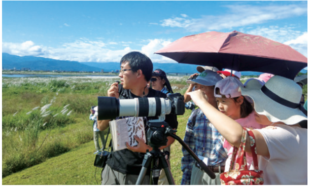
圖5、民眾透過賞鳥活動認識蘭陽溪口野生動物保護區與周邊田區的鳥類。