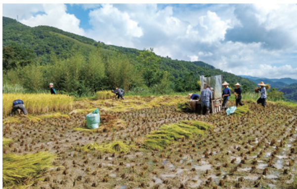
圖2、保存傳統農耕方式的貢寮水梯田呈現人與自然和諧共生。