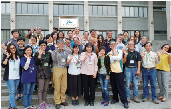
圖6、臺灣里山倡議夥伴關係網絡結合屏東科技大學社區林業中心之發展。

殖產業轉型等，讓點相連成線，串聯為國土綠網生態廊道。林務局結合地方政府、民間團體及在地社區多年地努力經營成龍濕地，在2018年12月獲行政院頒發「國家永續發展獎」。