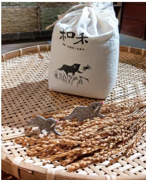
圖3、狸和禾小穀倉在貢寮老街成立實體店面，透過和禾傳遞保育的生態價值。

以臺灣東北部為例，串連雪山山脈北端，包含雙溪、田寮洋濕地、貢寮水梯田等水生動植物之重要棲地；結合蘭陽平原之雙連埤、蘭陽溪口及無尾港等野生動物保護區，輔導周邊農地轉型友善生產。林務局自2009年起即與人禾環境倫理基金會合作，推展新北市貢寮區雙溪河上游集水區河谷水梯田恢復蓄水及濕地生態，擴大濕地生物棲息空間，至今效益已逐