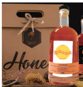
「都歷海蜂」蜂蜜商品合成示意圖，品牌logo設計理念以黃橘色系作為主要色彩，使消費者能馬上聯想起蜂蜜的香甜氣味，基底圓形代表影響海洋潮汐最重要的fulad「月亮」，八角花為都歷阿美族相當重要的傳統符號，常見於傳統織品、服飾中，並象徵蜜蜂採蜜的對象；波浪形的排列則是海浪波動的意向。 (圖/臺東處提供)

2623、2639號)兩大縱軸，串連東西向河川綠色廊道，如美崙溪、木瓜溪、花蓮流域，編織成一個完整保安林生態保育綠色網絡。透過平台夥伴討論，可確認保安林未來發展及問題解決對策，並藉由各夥伴專業協助，提高保安林經營管理效能，並推廣保安林優質環境，及各夥伴之間技術專業交流，協助社區人才養成，凝聚向心力，並建構在地公益領導能力，也強化保安林多元主體參與協力合作，透過社區協助調查人文與生態資源資料，進而保護保安林及保育當地生態資源。