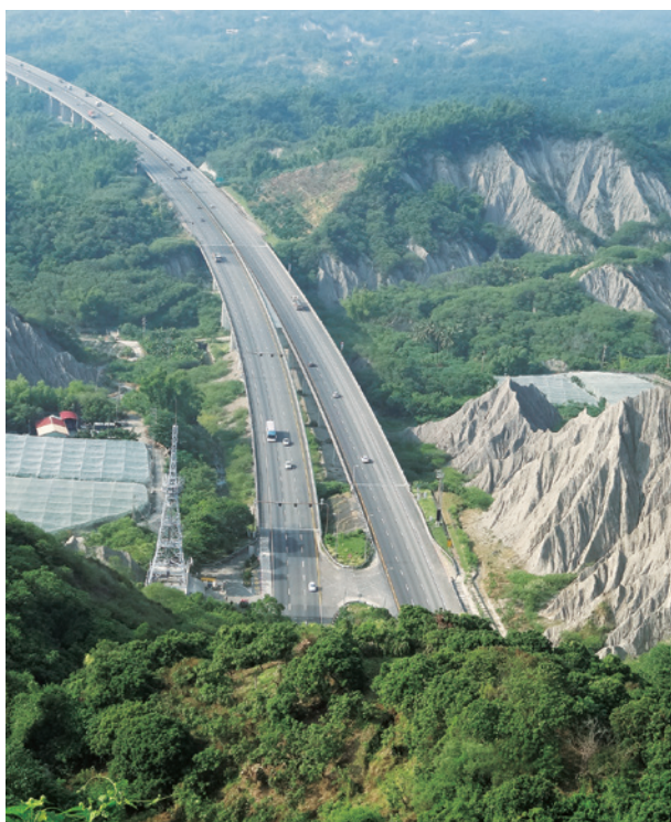
高雄市境內編號第2211號土砂捍止保安林。(月世界，屏東處提供)