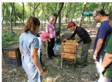
花蓮處保安林地林下養蜂。