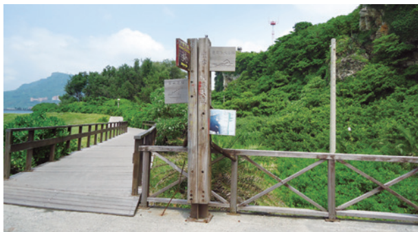
高雄市境內編號第2301號土砂捍止保安林。(臺灣第1號保安林)

山，均為臺灣罕見地理景觀，屬編號第2211號土砂捍止保安林範圍。屏東處與金山社區合作進行保安林動植物資源調查，並推展社區生態旅遊之套裝行程，包括傳統產業與技藝之傳承體驗、地質公園－惡地泥岩解說教案製作，教導居民共同維護生活環境與自然生態的永續發展，希望提升社區成為純樸、健康、有人情味，並提供自然生態教學、環境教育、休閒運動、農村文化體驗的深度旅遊的最佳場域，並增進社區居民對保安林的認識，透過解說而了解，透過了解而欣賞，透過欣賞而保護，目前已辦理環境教育活動16場次，參與人數達240人次，藉由活動使民眾理解，並欣賞保安林的各種價值，同時，還可以將森林資源、民眾、社區和管理緊密結合起來，進而提升社會大眾對保安林的支持度，將愛護森林資源及地質景觀環境的觀念傳達至社區居民下一代及社會大眾，讓民眾更加了解在地環境之特殊性，而更加珍惜及保護森林資源及地質景觀，改變了對惡地無法生產的觀念，自發性的守護保安林的珍貴資源。值得一提的是，屏東處在每月的社區訪視及舉辦的環教課程中，明顯感受到社區居民在參與計畫後，了解保安林雖因法規限制部分開發，並理解保安林之公益功能及環境保護的重要性，對保安林不再有疏離的感覺，並認同保安林可以幫助在地推展森林生態旅遊、環境教育等經營方式。