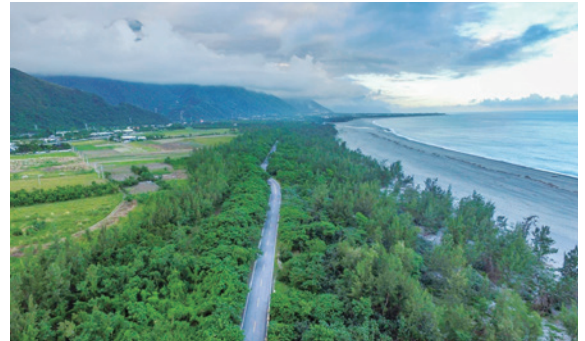
花蓮縣境內編號第2618號防風保安林。（七星潭，花蓮處提供）

芮氏規模6.0級、深度10公里的強烈地震，造成多棟建築物倒塌，許多民眾因此受到心理及財產上的傷害，依據國內外文獻研究發現，在森林裡從事療癒體驗活動，具有舒壓及提振精神等健康促進的效益，因而特別委請陽明大學林一真教授設計森林療癒體驗活動，並請中華民國戶外遊憩學會理事長李素馨參與指導，以及臺灣森林保健學會協助提供測量儀器，在七星潭旁編號第2618號保安林辦理3場森林療癒系列活動，參加對象為花蓮地區心理諮商師、國小輔導老師及民眾等計60人次，藉由五感體驗，使參與人員達到身心舒緩，並透過唾液澱粉酶的測試，客觀且科學地呈現森林療癒的成果。