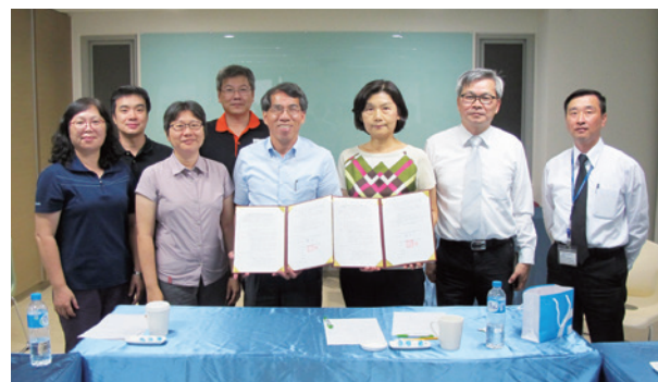
編號第1410號保安林認養簽署。