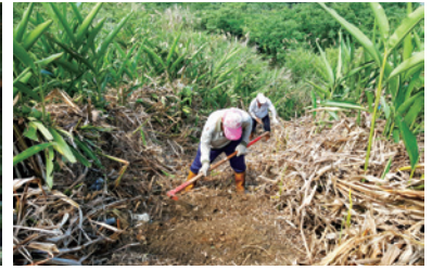
編號第2635號保林生態步道維護。

與森林的關係，並培養了對保安林的熱愛和保護森林的意識，在他們心中種下愛林護林的小樹苗。同時，與保安林周邊的小學生進行三天兩夜的暑期營隊，讓學童扮演調查團的成員，一一破解海岸林的謎題和越過重重關卡去探索東海岸、走訪石梯坪的漁業保安林、看森林如何發揮遮蔽陰影作用吸引近海魚群聚集及登上奚卜蘭島觀察島上的森林與生態，認識土砂停止保安林功能是如何防止崩落的砂釀成災害；和漫步在海稻田中認識里山里海倡議及阿美族的在地文化與生活等三大主題，讓參與的國小學生，在森林學習的活動過程中，瞭解漁業保安林化設目的與人與環境的關係。