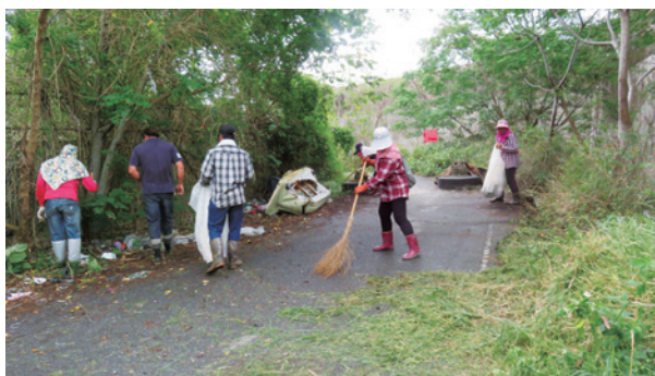
臺東縣原住民各部融岸文化教育促進會於第2514號保安林內進行環境維護。