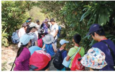
編號第2618號保安林環境教育生態解說。