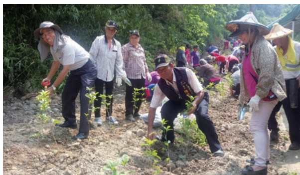
編號第1407號保安林植樹活動。