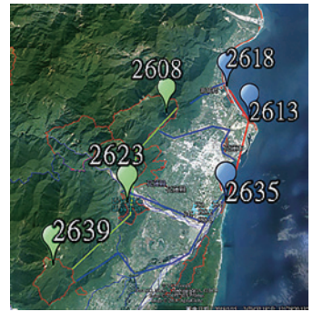
串連新城鄉至壽豐鄉區域的6個編號保安林及在地社區、NGO團體等共建東部保安林綠網平台。

初期以新城鄉至壽豐鄉之間6筆保安林為主，依保安林位置分成海岸線（編號第2618、2613、2635號）與縱谷線（編號第2608、