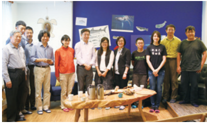
花蓮處辦理保安林與海的對話工作坊。