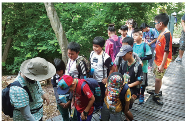
編號第2302號保安林之生物多樣性環境教育活動。