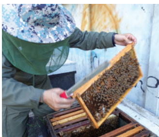
都歷社區養蜂計畫。