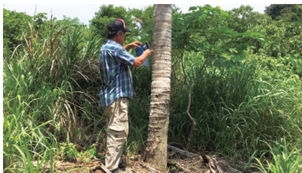
編號第2520號保安林巡護情形。