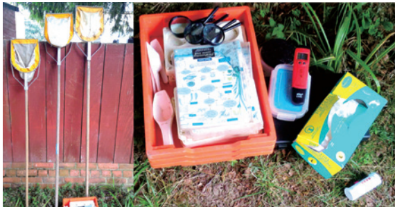
圖3、FSC依據不同主題發展之辨識圖卡。