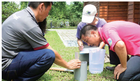
圖6、水循環的入滲與截留課程操作情形。

錄、彙整；唯有長期累計各面向的調查資料，透過深入的分析研究，才有機會為未來的人類解決現今無法解決之困境。累積大數據，是一項重要的使命。