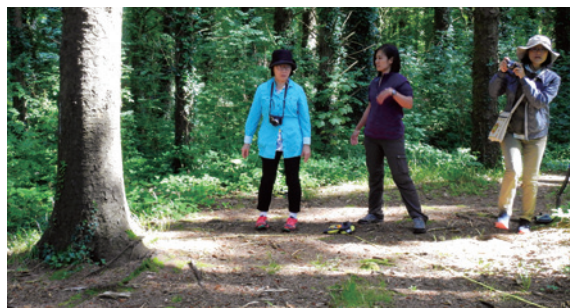
圖5、樹木的碳含量與生物量課程操作情形。

我們生存的地球隨時都在變化，然而生活在變化下的人們當下總是很難察覺，總要驀然回首才驚覺環境已遭逢巨變。很多狀況無法依靠短期的調查資料發現端倪，為了面對未知的未來，我們必須嚴謹地思考、規劃、調查、記