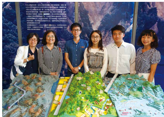
里山創作模型。