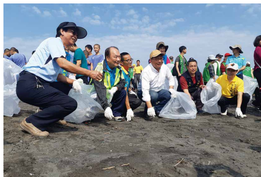
2019世界地球日「與野共生」，宜蘭壯圍植樹淨灘活動，彎腰拾廢守護海洋生物。