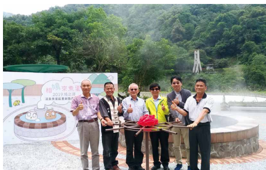
5月21日上午舉辦重新啟用鳩之澤溫泉煮蛋區，邀請來賓與現場遊客們一同「相鳩來煮蛋」。