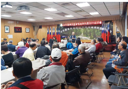
羅東處舉辦3場次與林農有約座談會加強與承租國有林地林農雙向溝通了解。