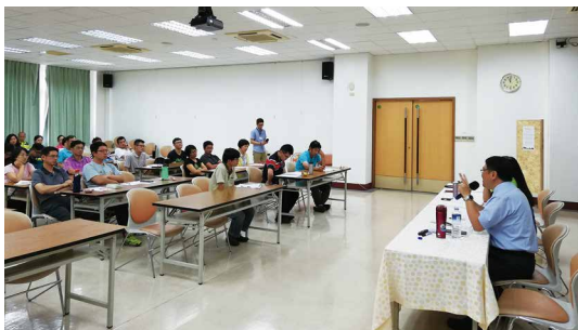
屏東處108年度專案廉政宣導座談情形。