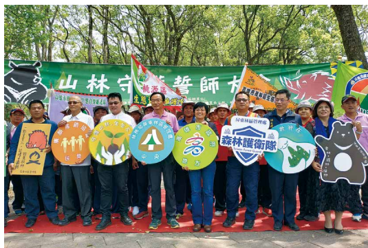
屏東林管處、高市原民會、橋頭地檢、六龜分局、保七大隊等及山林巡守隊會後合影。