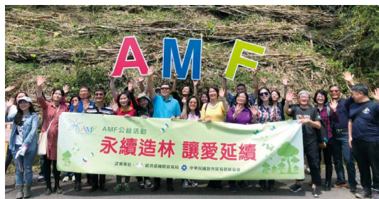
外貿協會認養保安林植樹計畫為「永續造林 讓愛延續」AMF（亞洲會展產業論壇）公益活動揭開序幕。