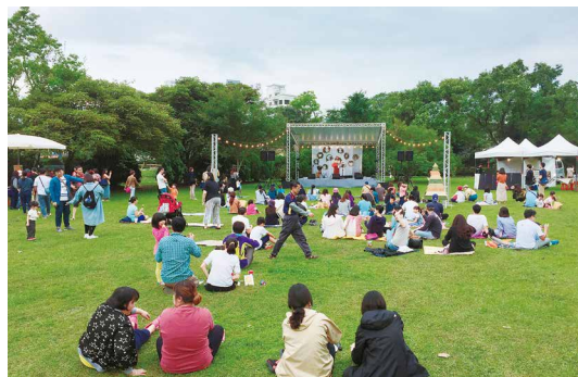
草地音樂會由8組在地歌手輪番演唱，襯托出園區悠閒、清新的氛圍。