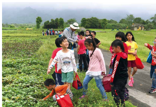
大進國小參加食農活動，親手採摘地瓜葉說要回家幫媽媽加菜。