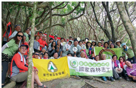
屏東處、臺東處、新竹處與嘉義處志工共同在觀音鼻大會師。