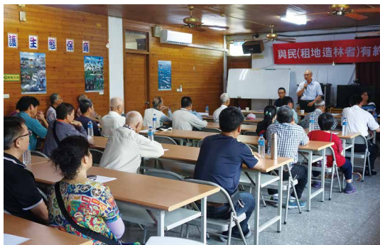
「與民有約」座談會。