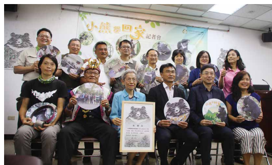
「小熊要回家」記者會合影。