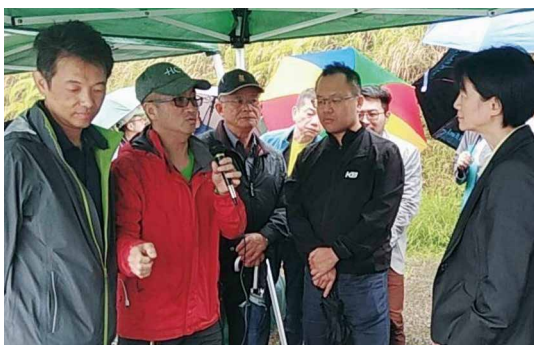
羅東處同仁於現場介紹科技器材監控偵緝及展現應用科技所破獲的案件。