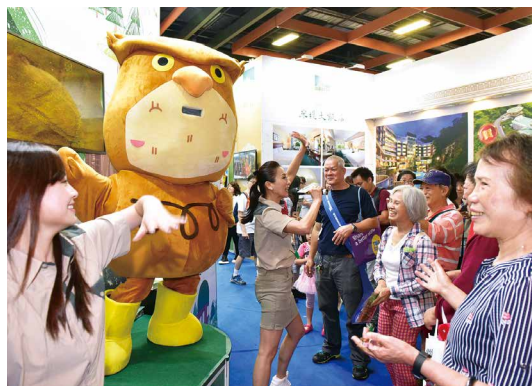
民眾熱情參與有獎問答活動。