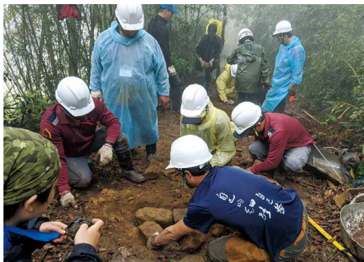
學員們就地取材共同修復步道。