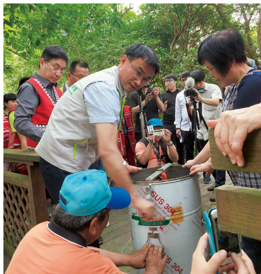
陳主委現場體驗搖蜜收穫香又純的「娃哇樂」蜂蜜。