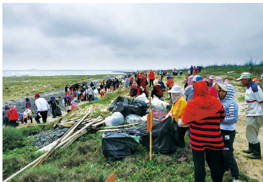
海岸淨灘大軍。