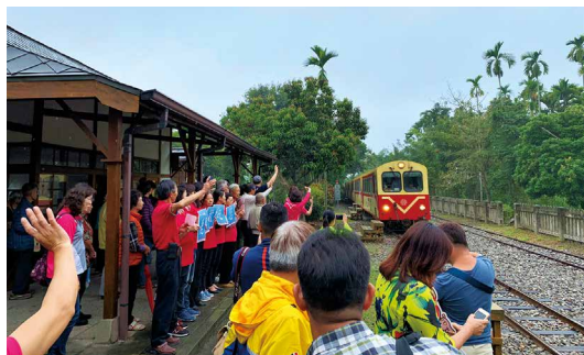
歷史性的一刻—列車停靠鹿麻產車站。