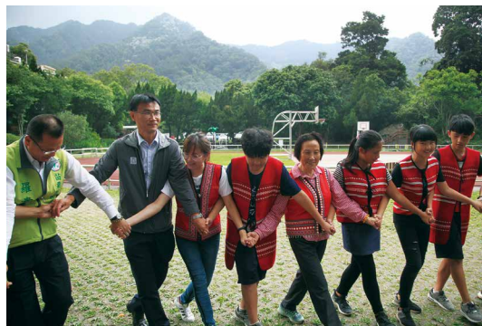
賽夏族人以迎賓舞熱烈歡迎陳主委及來訪貴賓。