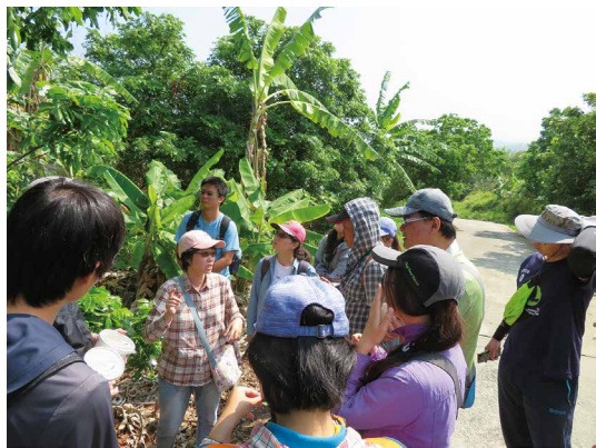
平腹小蜂釋放教學。