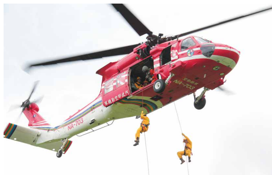
與黑鷹直升機共動吊掛訓練。