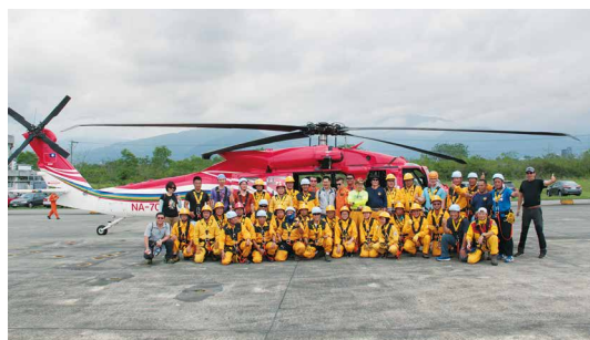
參與吊掛訓練的學員與教官合影。