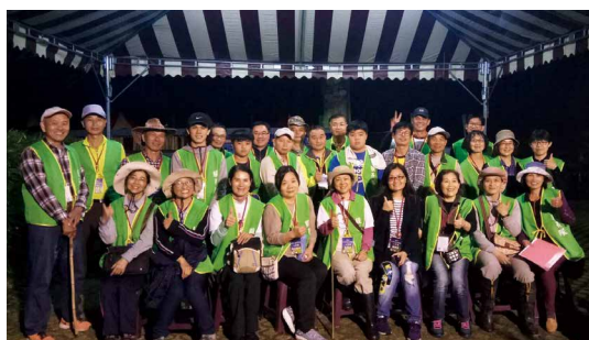
賞螢季期間皆由在地社區人力進行導覽解說，動員達1,200人次，提供專業且高品質的解說服務。