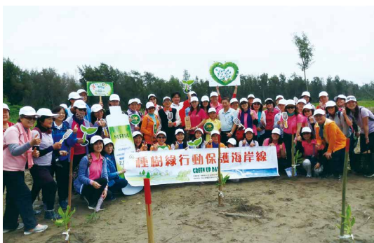
種樹綠行動保護海岸線。