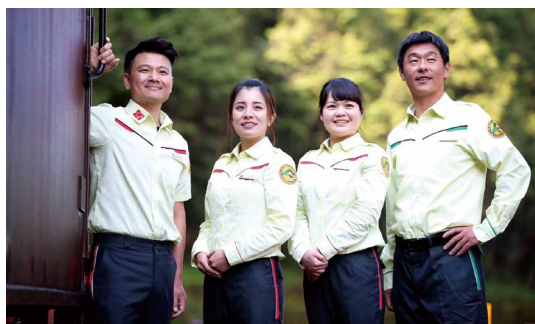
阿里山車站一整裝待發。(攝影／阿里山林業鐵路及文化資產管理處 吳明翰)