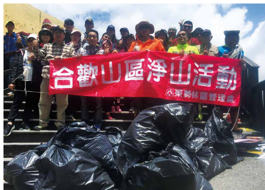
合歡山春季淨山活動撿拾垃圾成果合影。