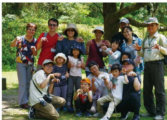
走完步道、聽完穿山甲解說，學員們開心地合影為這次活動畫下完美句點。