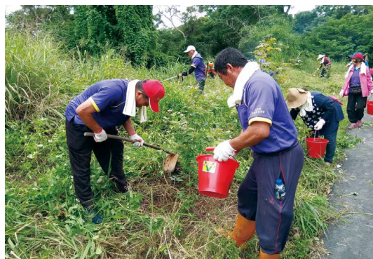
在地里民進行友善生態除草及施肥，共同保護保安林。