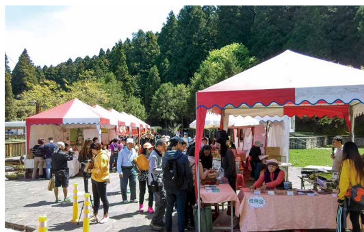
阿里山森林市集。