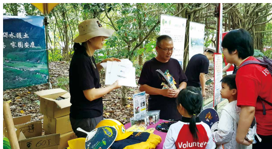
透過有獎徵答宣導保安林相關知識。