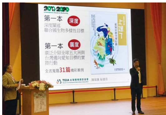
林務局局長林華慶主持生物多樣性論壇開幕，推薦生物多樣性主流化專書「上課了！生物多樣性第五冊『愛知目標全球行動』」。