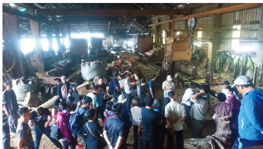
學員至栗東木業製材廠觀摩俗稱大剖的鋸木機等製材工具及流程。