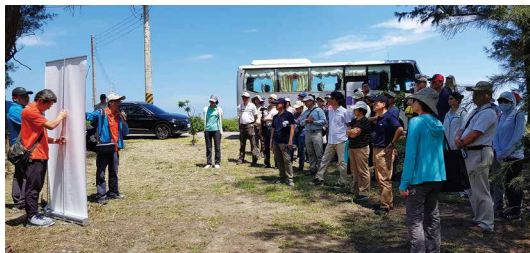
嘉義縣布袋鎮境內編號第1920號飛砂防止保安林公私協力執行成果觀摩。