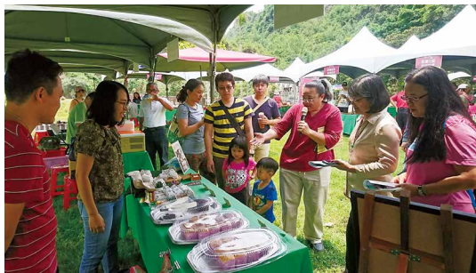
六龜好集市巡禮。