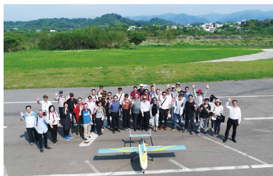
全體參訪成員與農航所熊鷹合影。