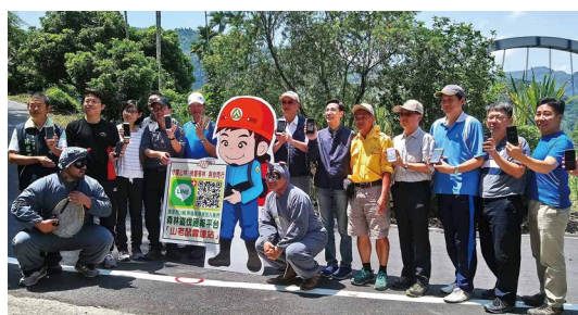
檢警移林加入森林盜伐通報平台。