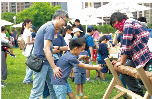
參加民眾執手鋸鋸切原木再一片片打磨製成杯墊。