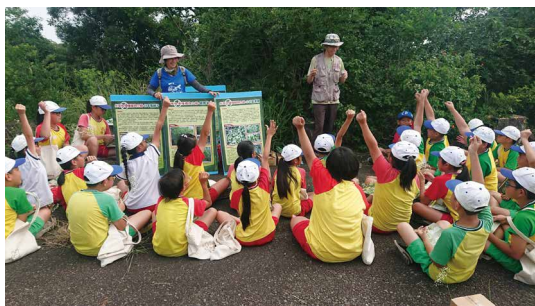
臺中市野鳥協會專業講師講述外來入侵種植物介紹。