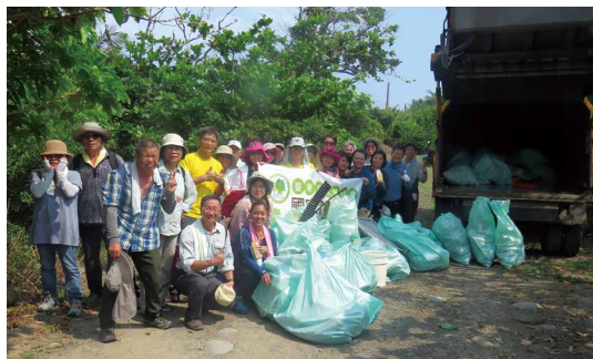
達仁鄉公所垃圾車協助清運活動所清理的海灘垃圾。