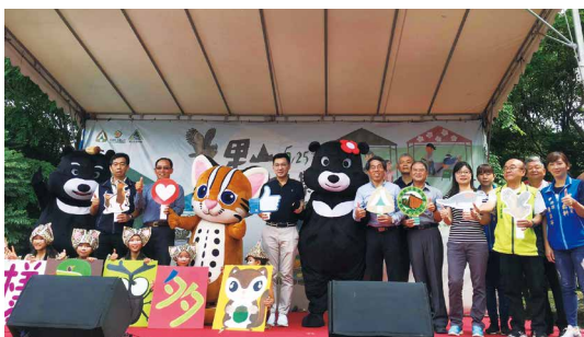
「2019里山生活市集」活動熱鬧開幕邀來賓合影。