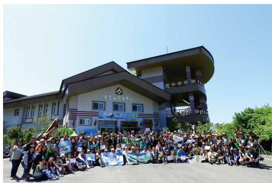
「2019大雪山飛羽·風情萬種賞鳥大賽」參賽隊伍合影。