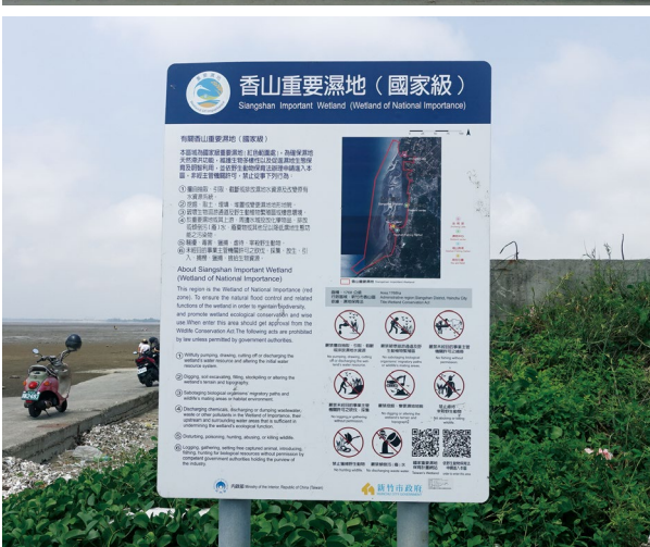
圖6、社區辦理濕地生態解說維持社區產業。