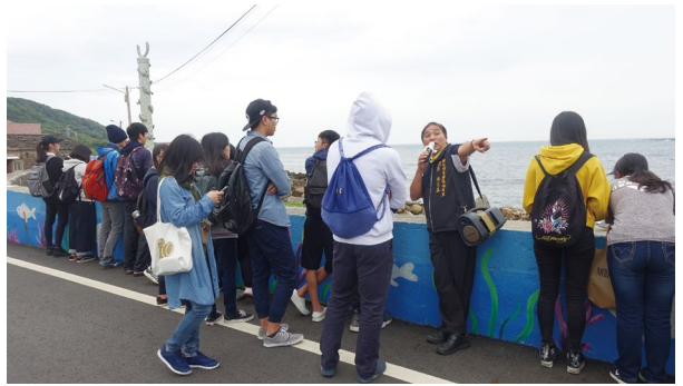
圖5、社區透過導覽解說傳遞栽培漁業的永續觀念。