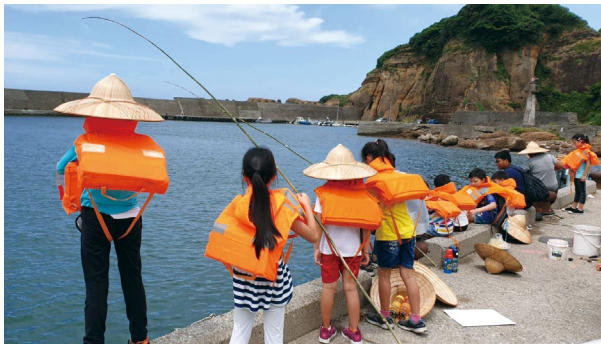
圖3、濂新社區透過社區耆老在水湳洞漁港帶領學生體驗釣魚樂趣。