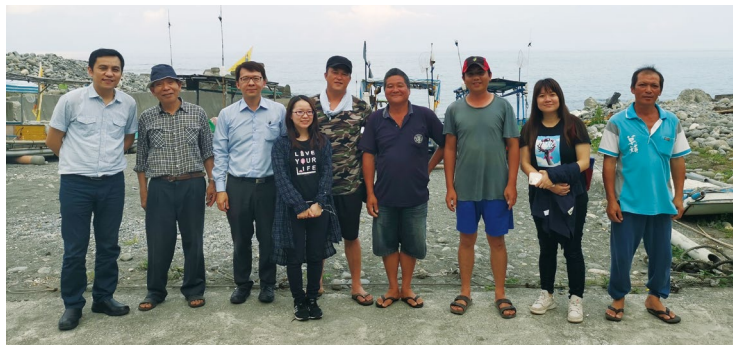
圖14、新社區青年關注環境與資源永續。