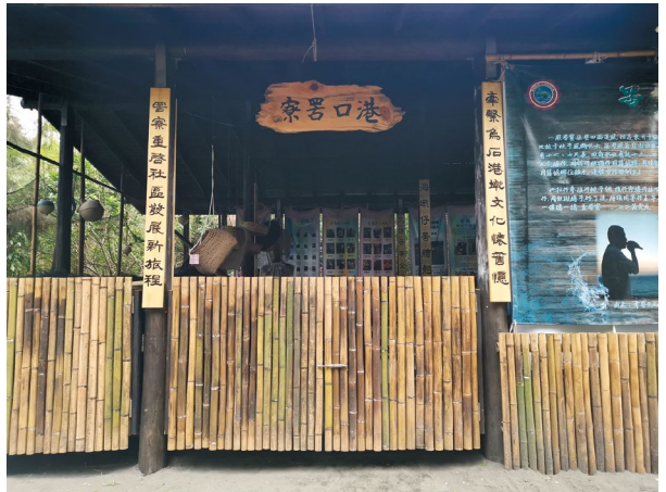
圖9、港口社區設置罟寮保存漁業文化。