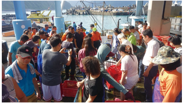
圖12、東澳社區定置網作業漁船進港的爭搶魚獲（搶魚）。