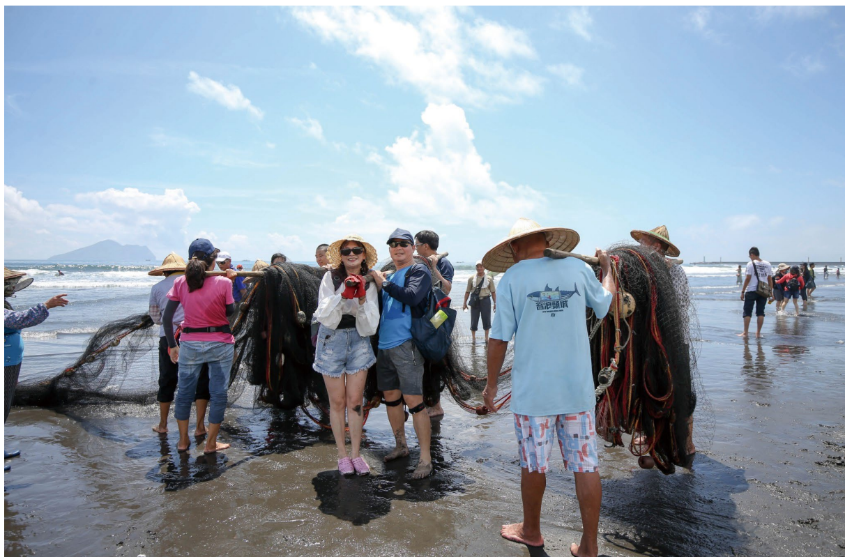
圖8、港口社區辦理牽罟體驗。