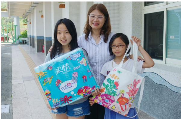
圖4、濂洞國小扎根海洋教育，傳遞學生海洋創意產品。