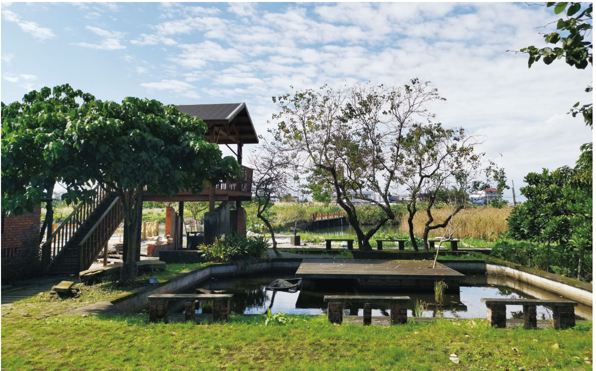
圖11、後埤社區地景營造獲臺灣景觀大賞社區營造類首獎。