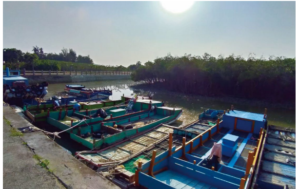
圖7、塭內社區盼轉型活化，運用舢舨於中港溪內河進行生態旅遊。