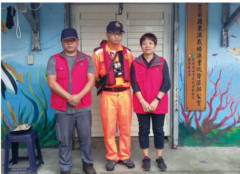
圖13、東澳社區籌組栽培漁業巡守隊，落實社區自主管理。