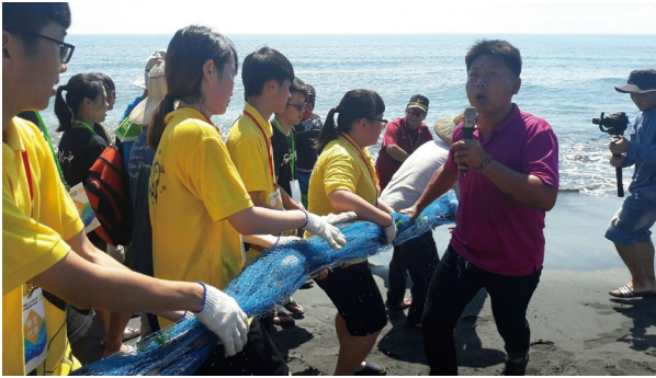
圖10、後埤社區辦理成年禮與牽罟體驗活動。