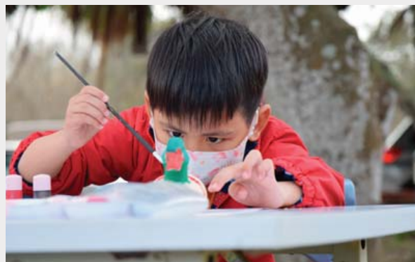
攝影／嘉義林區管理處 黃秀緞