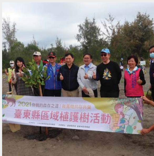
▲ 臺東縣區域植護樹活動