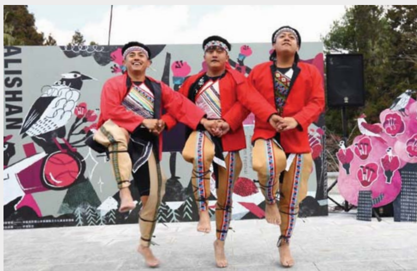
▲ 鄒族樂舞嘹亮活力揭開序幕