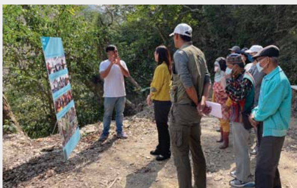
攝影／屏東林區管理處 黃昱嘉

屏東林區管理處支持執行的「大武部落巡水路邊坡以魯凱傳統工法營造石板文化矮牆暨專業導覽人員培訓」，在屏東縣霧臺鄉大武部落辦理計畫成果展，展中除了帶著來賓參觀傳統砌石工法所構築的巡水路外，也表揚了8位耆老，感謝他們無私付出總計4,800小時的砌石工藝傳承，同時也頒發了大武部落自然人文生態景觀區專業導覽人員證書，授證的21名族人將是未來部落觀光發展的生力軍。(屏東林區管理處 黃昱嘉)