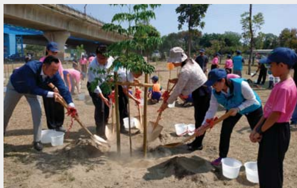
▲ 參與的貴賓及民眾共同植樹建構高屏溪的森存之道