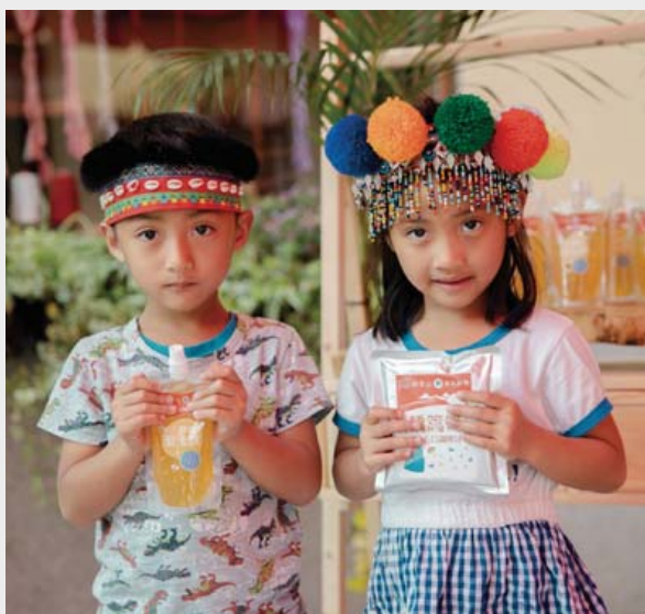
▲ 與輔大食科系合作開發的人氣商品

為振興山村經濟及協助部落發展，嘉義林區管理處盤點阿里山特有農林產物，經部落共識會議後，選擇阿里山愛玉及竹筍成為「森林餐桌」的主角，並於臺中審計新村舉辦「阿里山（鄒）森林好物」成果發表會，未來透過紅色圖騰識別標章，即可辨識來自阿里山部落居民所生產的「森林好物」；另與輔大食科系合作開發的人氣商品阿里山愛玉吸凍、轆簞筍五目炊調理包，更可讓民眾將阿里山的滋味帶回家品嚐。（嘉義林區管理處 黃淑芳）