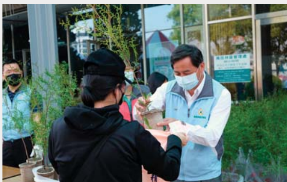
▲ 南投林區管理處舉辦贈苗活動