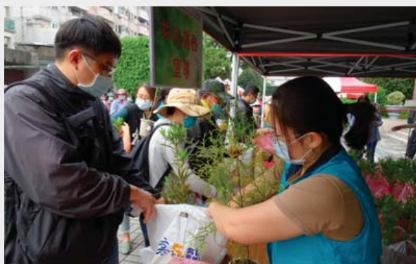
▲ 民眾依序領取苗木