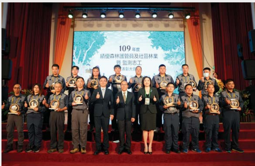
▲ 優秀及傑出森林護管員得獎者合影