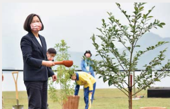
▲ 總統蔡英文於潮境公園親自種下森氏紅淡比