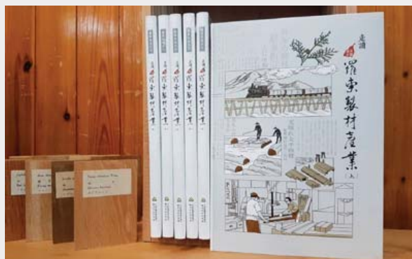
▲ 「走讀羅東製材產業」新書上架