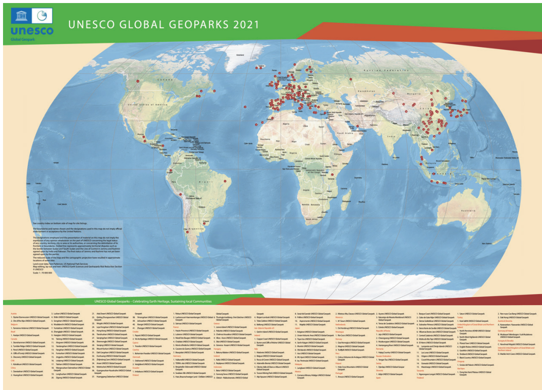
教科文組織世界地質公園分布圖

世界地質公園的認證及重新驗證，乃是透過世界地質公園網絡來執行，認證任期為4年。在重新驗證過程中，徹底重新審查每個世界地質公園運作品質。重新驗證過程，地質公園必須編寫進度報告，兩名評估員將進行實地考察。如果實地評估報告，地質公