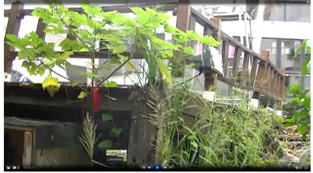
龍泉水段 804-2 地號