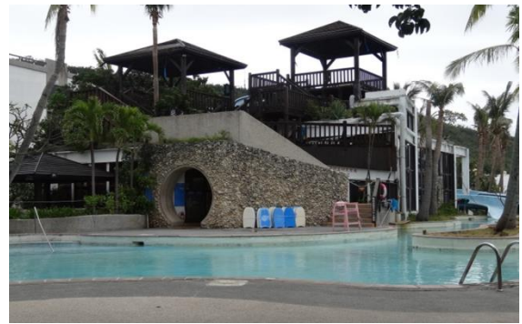
龍泉水段 803 地號