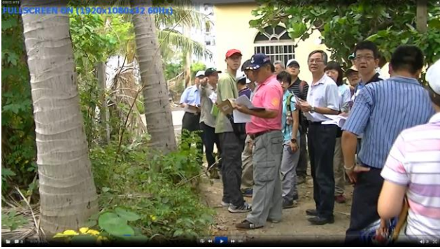
龍泉水段 803 地號