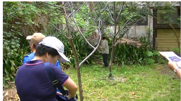
龍泉水段 802 地號