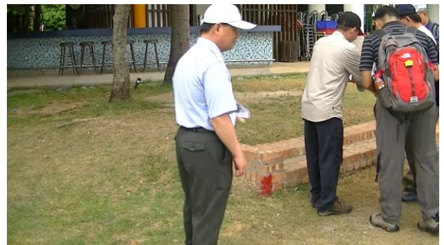
龍泉水段 800-1 地號