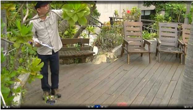
龍泉水段 799-1 地號