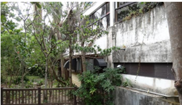
龍泉水段 803 地號