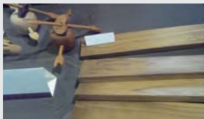
應用壓密化技術開發之愛神邱比特之箭與杉木板