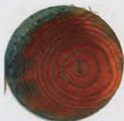
未經橫向壓縮處理之 柳杉原木防腐劑滲透圖 (無法達k4等級防腐)