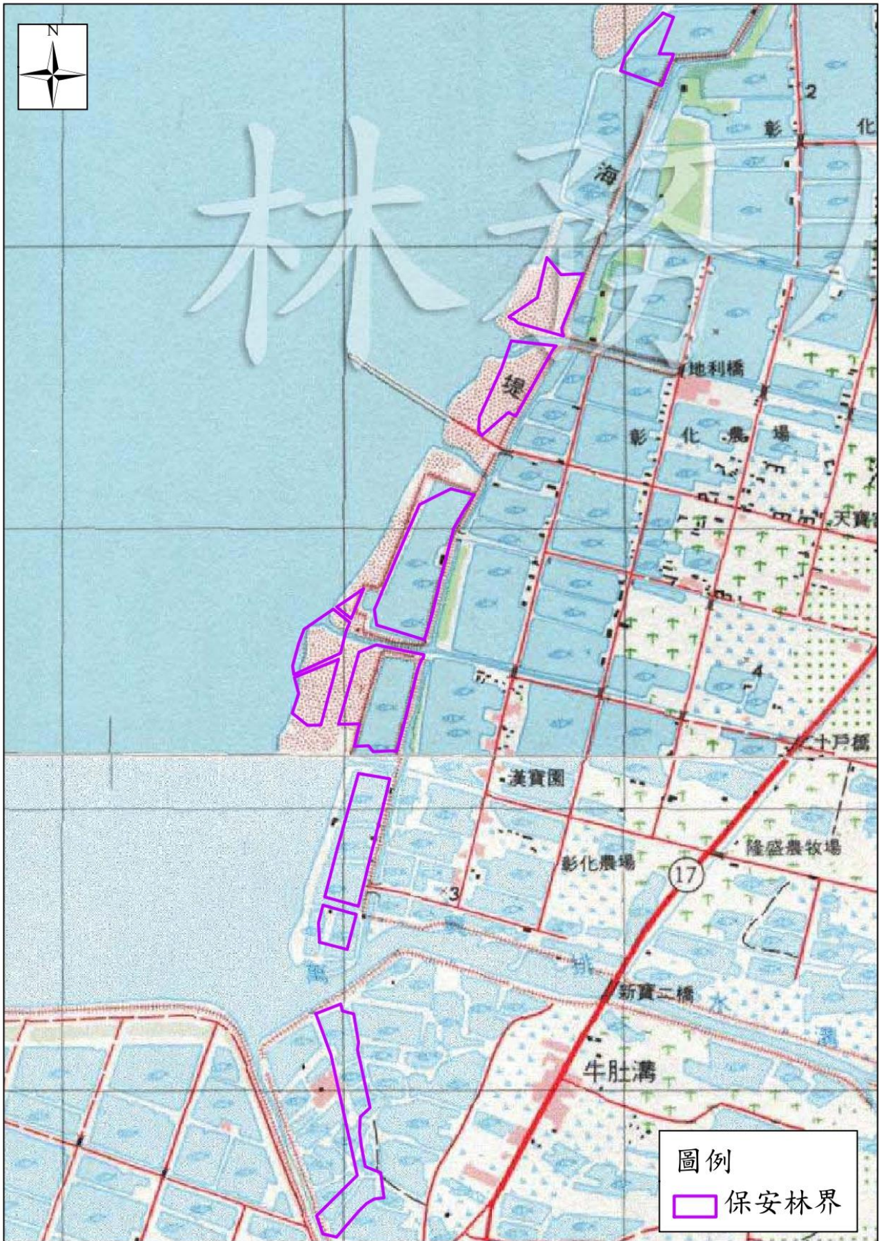
附圖一、編號第 1707 號保安林地理位置圖