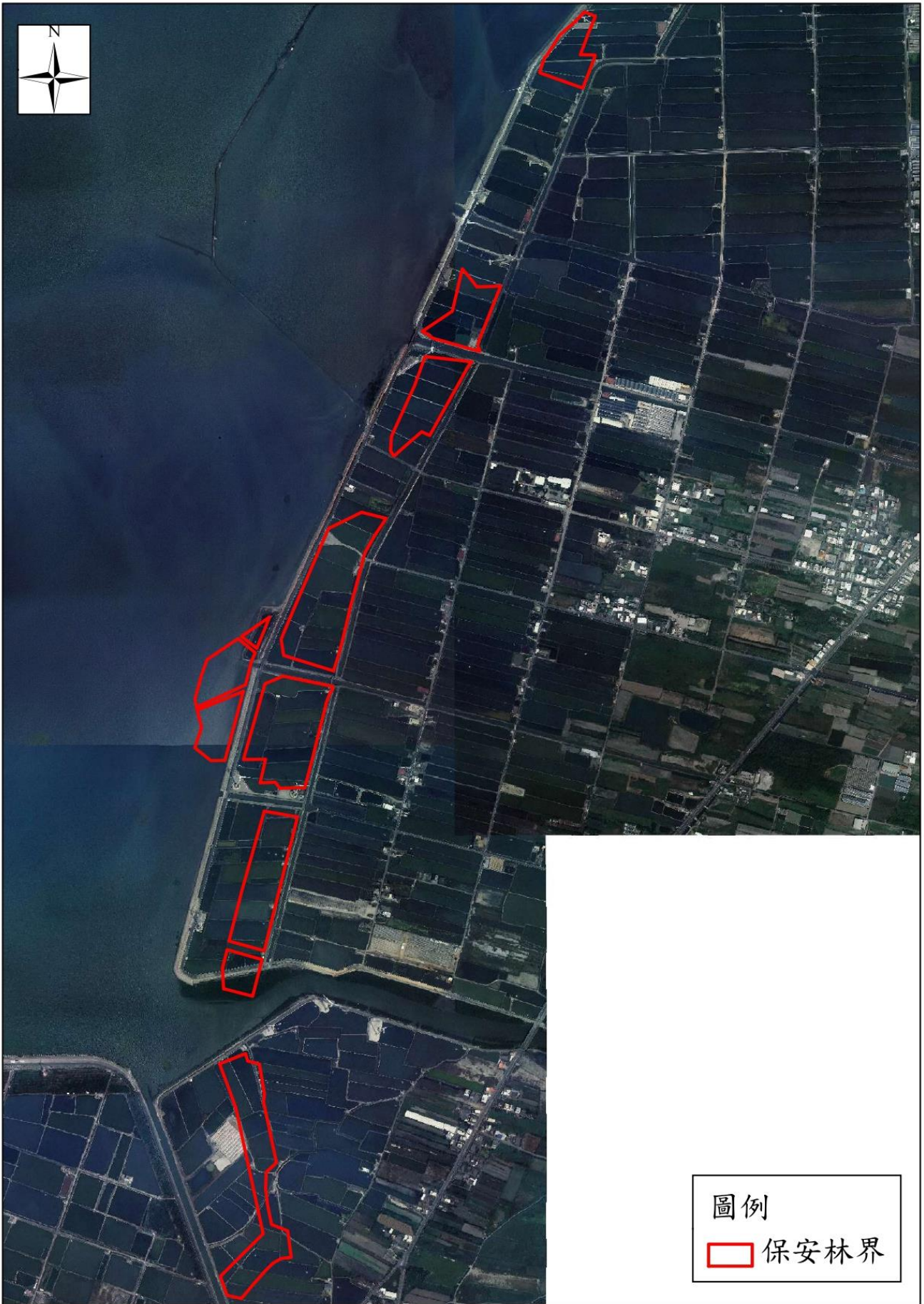
附圖二、擬解除第 1707 號保安林位置圖(111 年 10 月 7 日正射影像)