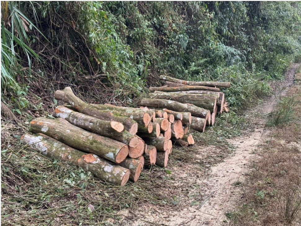
阿里山及大埔事業區林班現場堆置木材情形