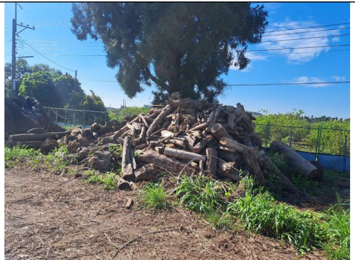
114 屏賊 5 號