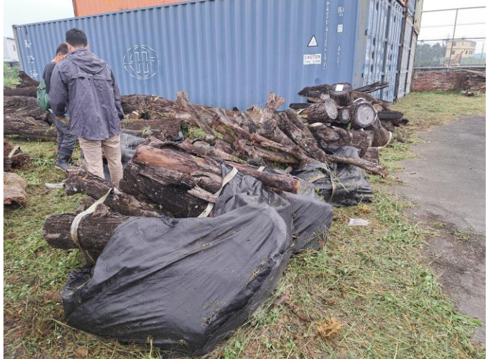
114 屏賊 4 號