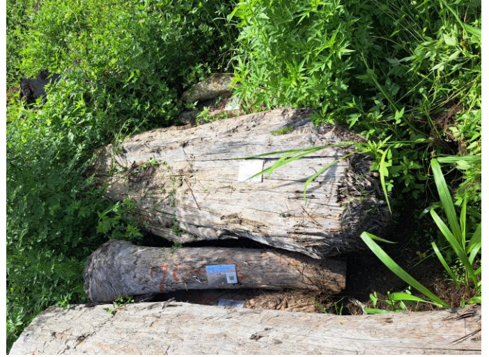
114 屏賊 3 號