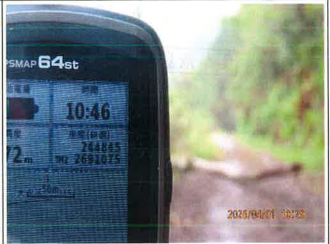
雪山坑林道倒木機車可通行