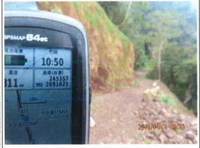
雪山坑林道巡視路面良好