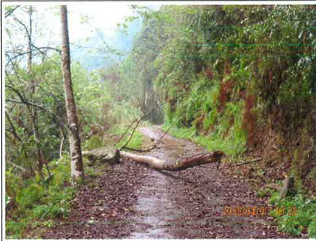
雪山坑林道倒木機車可通行