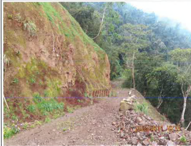
雪山坑林道巡視路面良好