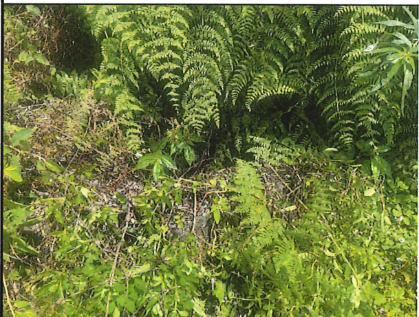
照片5：中平林道7k+300處座標X：279721、Y：2590234。排水溝雜叢生淤積。