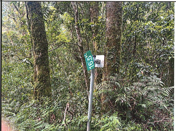
照片16：中平林道16k+500處座標X：276211、Y：2590689。中平林道公里標示牌損壞。