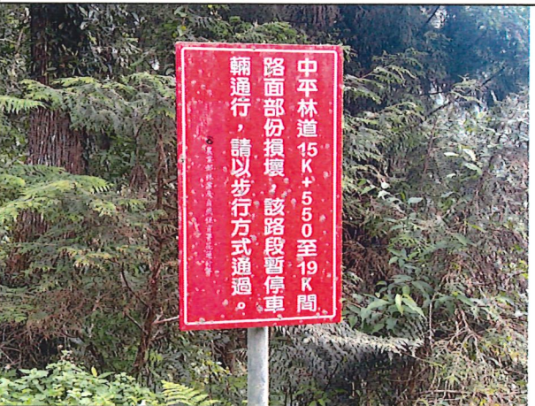
照片17：中平林道15k+100處座標X：277226、Y：2590631。林道告示牌誌路段以改善竣工車輛可通行，建議移除臨時牌誌。