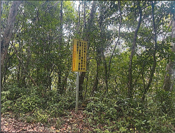
照片19：中平林道5k+700處座標X：280457、Y：2589895。林道告示牌誌路段以改善竣工車輛可通行，建議移除臨時牌誌。