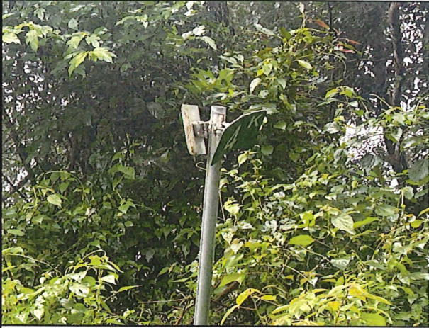
照片13：中平林道4k處座標X：281596、Y：2589968。中平林道公里標示牌損壞。