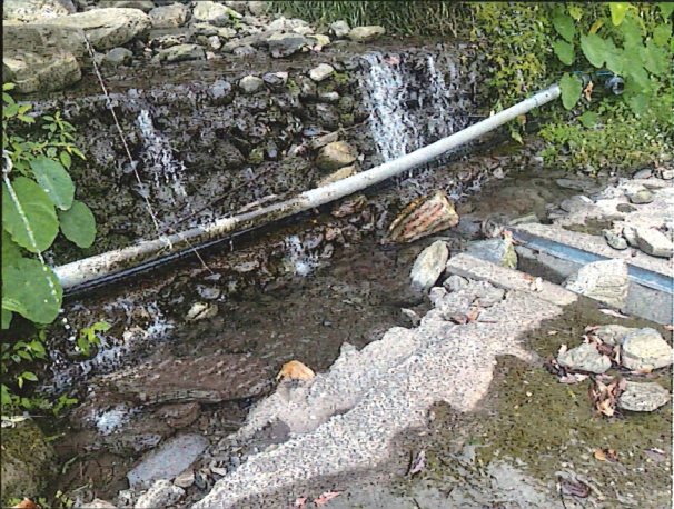
照片9：中平林道6k+600處座標X：279700、Y：2589547。林道簡易友善措施淨水池土石淤積，爬坡道攀爬網損壞。