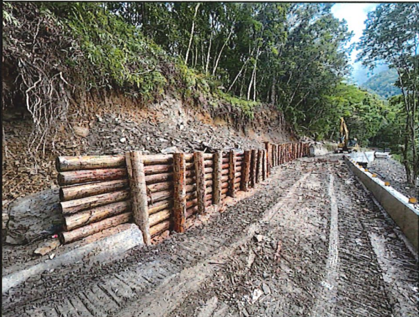
照片21：中平林道9k+300處座標X：279036、Y：2591208。林道改善工程路面及上、下邊坡施工作業中。