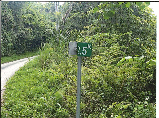
照片12：中平林道2k+500處座標X：281523、Y：2588895。中平林道公里標示牌損壞。