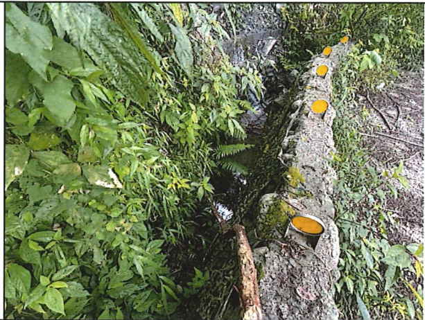
照片8：中平林道6k+800處座標X：279783、Y：2589643。淨水池雜叢生無淤積。