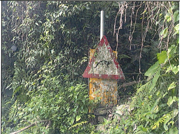
照片10：中平林道2k+600處座標X：281517、Y：2589013。注意動物減速慢行牌誌汙損，建議拆除或更新。