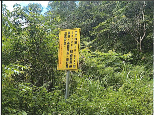
照片20：中平林道6k+200處座標X：280135、Y：2589575。林道告示牌誌路段以改善竣工車輛可通行，建議移除臨時牌誌。