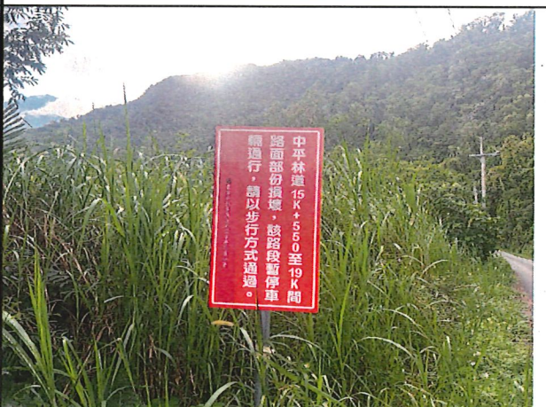
照片18：中平林道0k0處座標X：281994、Y：2588332。林道告示牌誌路段以改善竣工車輛可通行，建議移除臨時牌誌。