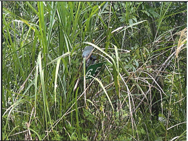
照片14：中平林道6k+500處座標X：279743、Y：2589499。中平林道公里標示牌損壞。