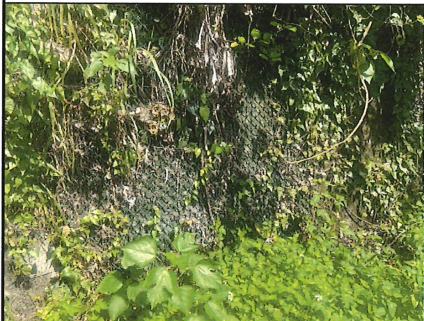
照片3：中平林道2k+500處座標X：281520、Y：2589014。 中平林道簡易友善措施擋土牆攀爬網。