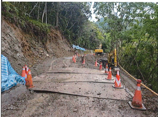
照片1：中平林道9k+300處座標X：279036、Y：2591208。 林道改善工程路面及下邊坡施工作業中。