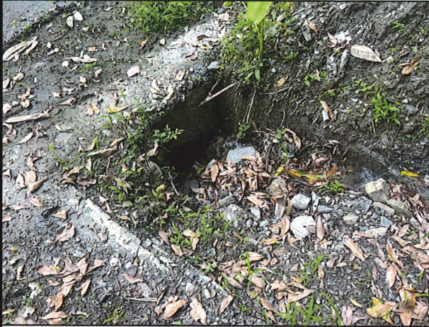
照片7：中平林道6k800處座標X：279783、Y：2589647。排水溝土石淤積。