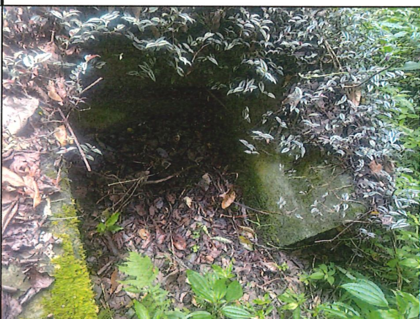
照片6：中平林道6k900處座標X：279820、Y：2589758。排水溝雜叢生淤積。