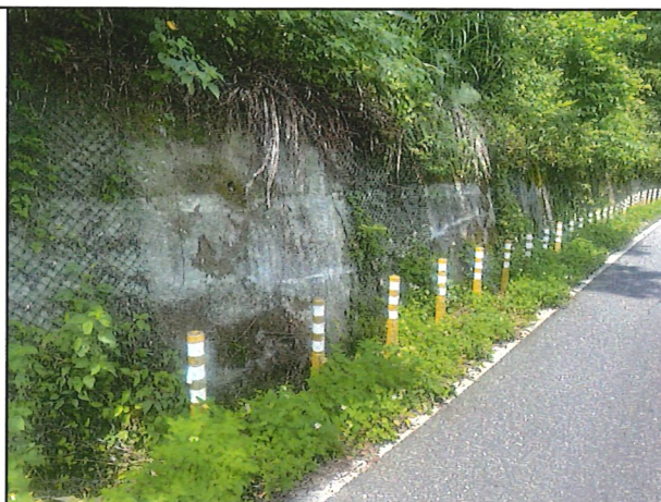
照片2：中平林道2k+800處座標X：281575、Y：2589092。 中平林道簡易友善措施擋土牆攀爬網。