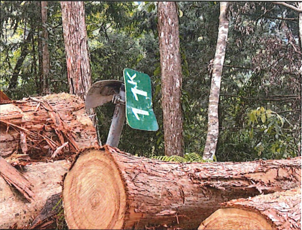
照片15：中平林道11k處座標X：278024、Y：2590527。中平林道公里標示牌損壞。