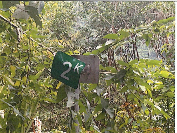
照片11：中平林道2k處座標X：281751、Y：2588567。中平林道公里標示牌損壞。