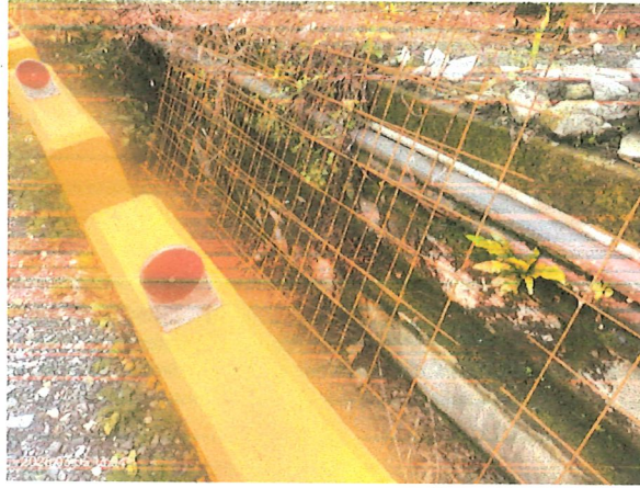
2K+140 林道鋪設水泥路面施工(未完工)