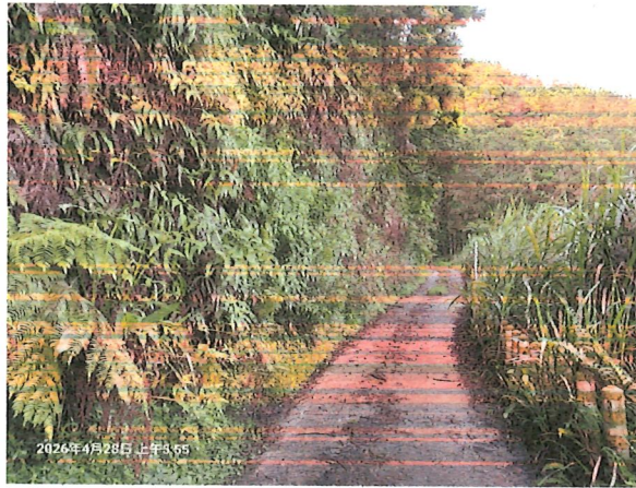
7K+350 開口契約已完成鋪設水泥路面現況照片