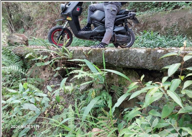
裡冷林道6K+300處，林道路面下方有掏空的情形，目前沒有太大的變動，持續觀察中。