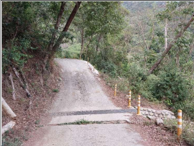
裡冷林道11K+400處，水泥路面有裂開下陷，裂痕有變寬的情形，掏空部分目前已經有墊石頭及水泥，路面落差也已用土石填補，持續觀察中。