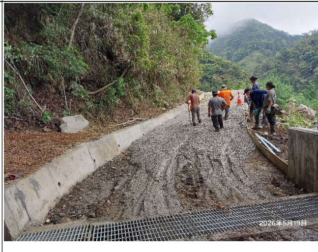
裡冷林道13K+400處，目前在進行路面灌漿，車輛無法通行。