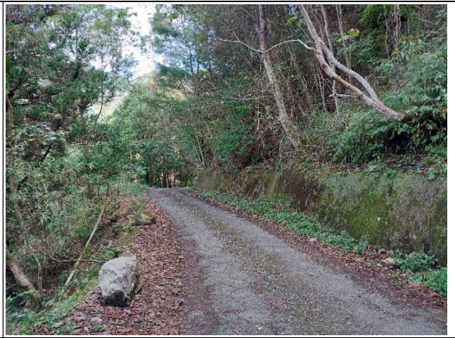
裡冷林道6K+300處，林道路面下方有掏空的情形，目前沒有太大的變動，持續觀察中。