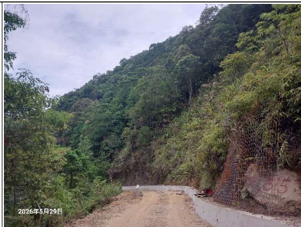
裡冷林道9K，目前在進行路面灌漿，車輛無法通行。