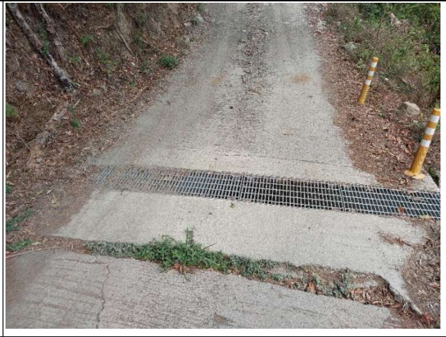
裡冷林道11K+400處，水泥路面有裂開下陷，裂痕有變寬的情形，掏空部分目前已經有墊石頭及水泥，路面落差也已用土石填補，持續觀察中。