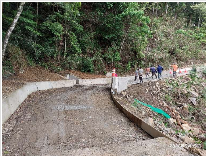
裡冷林道13K+400處，目前在進行路面灌漿、整地放鐵網，車輛無法通行。