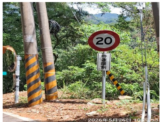
3k 時速限制告示牌良好