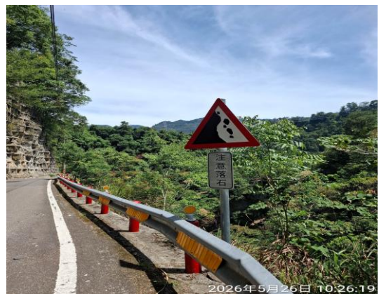
4k 注意落石告示牌良好