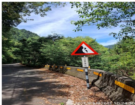
3.5k 注意落石告示牌良好