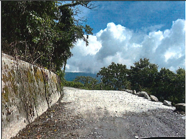
照片2：中平林道7k+600處座標X：279731、Y：2590303。 林道改善工程路面鋪設水泥路面完工現況。