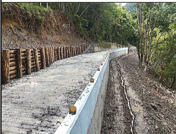
照片5：中平林道9k+300處座標X：279062、Y：2591374。林道改善工程上下擋土牆、路面鋪設水泥路面量測綠化完工現況。