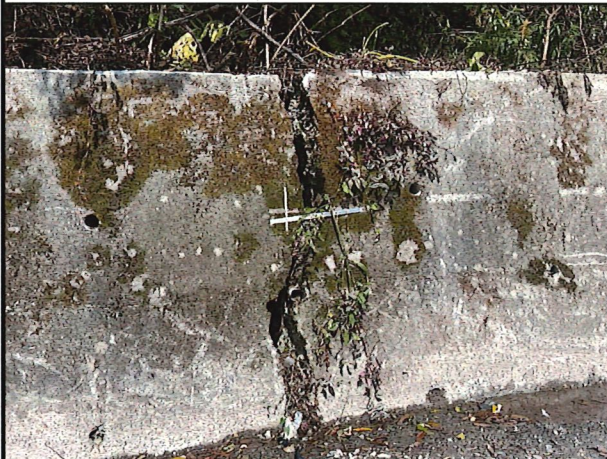
照片3：中平林道6k+890處座標X：279698、Y：2589561。 擋土牆開裂尺標監測中。