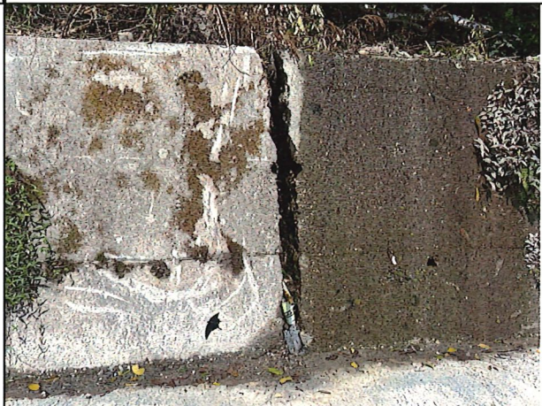
照片4：中平林道6k+900處座標X：279698、Y：2589561。 擋土牆開裂尺標遺失。