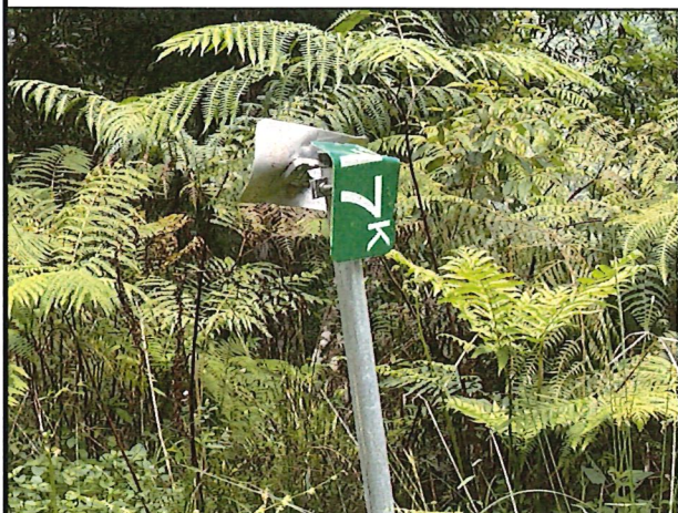
照片7：中平林道17k處座標X：275887、Y：2590694。里程標示牌損壞變形。