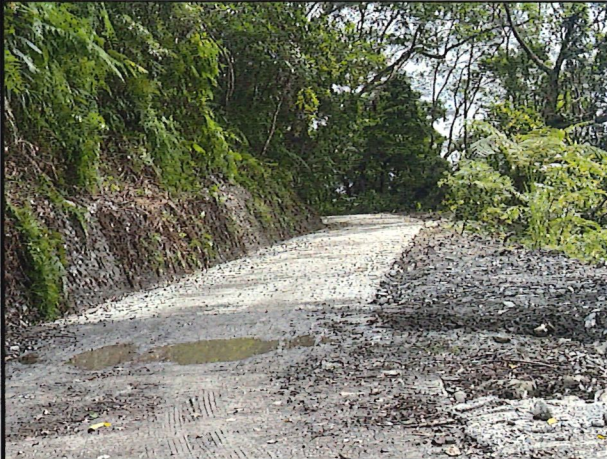
照片1：中平林道6k+900處座標X：279698、Y：2589561。 林道改善工程路面鋪設水泥路面完工現況。