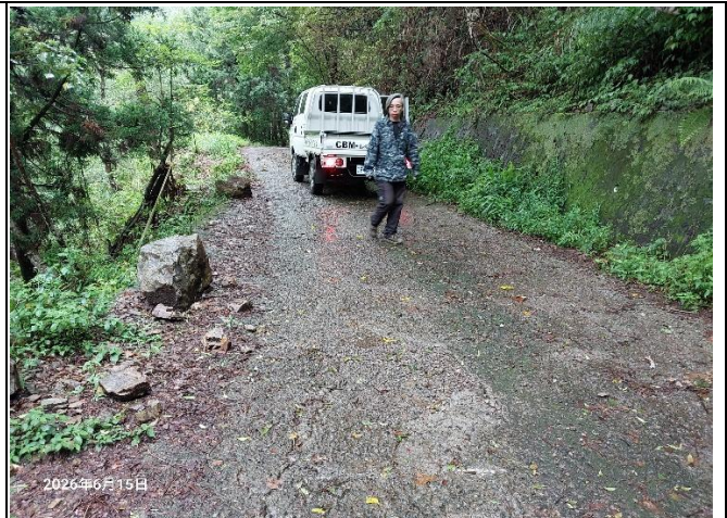
裡冷林道6K+300處，林道路面下方有掏空的情形，目前沒有太大的變動，持續觀察中。