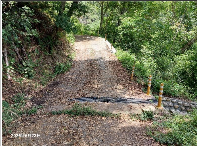
裡冷林道11K+400處，水泥路面有裂開下陷，裂痕有變寬的情形，掏空部分目前已經有墊石頭及水泥，路面落差也已用土石填補，持續觀察中。