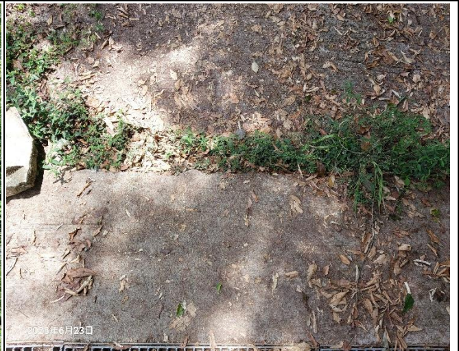
裡冷林道11K+400處，水泥路面有裂開下陷，裂痕有變寬的情形，掏空部分目前已經有墊石頭及水泥，路面落差也已用土石填補，持續觀察中。