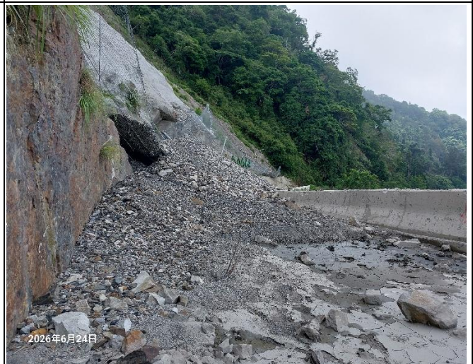
裡冷林道18.5K處，土石崩落至路面，車輛無法通行。