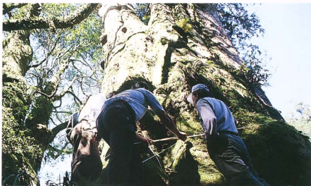
圖 8 達邦巨木。