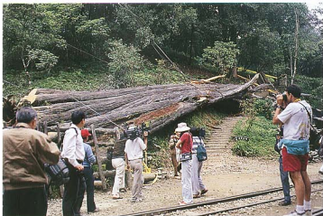
圖3 阿里山神木於87年6月29日放倒，引來媒體作見證。

侵蝕而致樹幹中空、腐朽，木材利用價值大為降低，因此逃過斧斤，留存至今日即成了神木，尤以阿里山神木最負盛名，其實附近比阿里山神木還大的紅檜巨木尚有不少，樹形雄