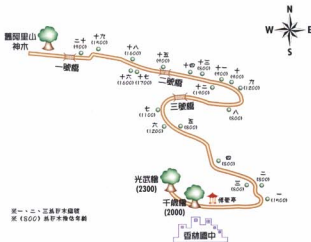
圖6 巨木群棧道沿線二十株巨木分布圖