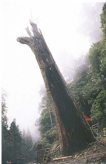
圖2 86年7月1日阿里山神木斷裂倒伏。

見幾經討論，最後基於安全、景觀、經濟及自然考量，決定將屹立之2/3放倒，讓神木回歸自然，87年6月29日神木放倒，這歷史性的一刻吸引大批人潮至現場做見證（圖3）。