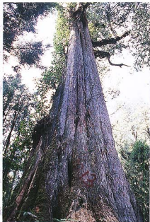
圖5 十二號巨木胸圍 12.1 公尺是巨木群步道沿線最大者。

偉、造型奇特、生機盎然各具特色，阿里山神木撕裂後掀起一陣神木熱潮，為提供其他神木詳細資料，筆者奉派調查阿里山地區巨木，得有幸親睹各株紅櫨巨木，並為其作紀錄。