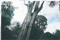
圖1 83年阿里山神木裂隙加大。

民國42年阿里山神木遭雷擊，起火燃燒。民國45年6月7日二度遭雷擊，導致樹幹內部中空炭化，上半身枝桠全枯，基幹高度僅35公尺，胸高直徑4.66公尺，胸圍14.6公尺。民國51年為延續阿里山神木精神，林務局在神木頂端架上木箱放置泥土，栽種7株紅檜苗木。