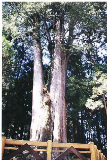
圖4 千歲櫨位巨木群入口。