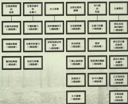
▼圖二 加拿大準則和指標的架構

與其社會。六個永續森林經營的準則被確認如下：準則一、生物歧異度的保育；準則二、維持和促進森林生態系條件和其生產力；準則三、水土資源的保育；準則四、森林生態系對全球生態循環的貢獻；準則五、森林多方面的利益；準則六、具有社會責任的永續發展。每一準則區分成若干要素（共22個要素），這些要素包含83個指標來完成永續發展（如圖二）。