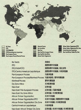
▲圖一 永續森林經營準則和指標的區域和國際歸屬

ture Organization, FAO)和聯合國環境規劃組織(UN Environment Programme, UNEP)主辦的研討會包括 27 國鄰近撒哈拉沙漠的國家，開始發展非洲乾燥地區森林的 7 個國家尺度的準則和 47 個指標。類似聯合國糧農組織和聯合國環境規劃組織主辦的研討會在埃及開羅(Egypt Cairo)召開，提議近東地區永續森林經營的 7 個國家尺度的準則和 65 個指標。由佔非洲森林覆蓋的 87% 的 13 個國家所組成的非洲木材組織(African Timber Organization, ATO)，經由野外(田間)試驗確認森林經營的準則和指標。野外試驗在 Cote d'Ivoire (1995)及喀麥隆(Cameroon 1996)更進一步試驗確認永續森林經營和木材貿易的 28 個 ATO 準則和 60 個指標。