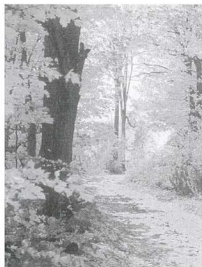
柄、電線桿、活性炭、坑柱、木橋、枕木、精油。