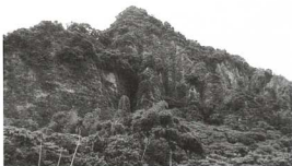
▲二水台灣獼猴自然保護區

“二水台灣獼猴自然保護區”位於彰化縣二水鄉鼻子頭段，屬南投林區管理處，八卦山台地中下段之區外保安林，中心位置約為北緯23°42'，東經120°40'，海拔在175公尺至417公尺之間（依據81年7月相片基本圖修測），面積94.02公頃。保護區外圍地帶農業發達，主要作物除了水稻外，尚有茶園、竹園、檳榔及各種果園（如鳳梨、釋迦、柚子、蓮霧、柑橘、甘蔗、番石榴等）。保護區的東南方靠近員集公路、集集鐵路及八堡圳引水渠道、交通便利、鄰近鄉鎮人口衆多，保護區附近大部份區域均已被開