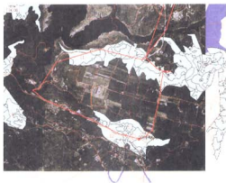
圖 6 巡視人員巡視路線

圖例：先以像片基本圖掃描後做為底圖，將數位化後之林班圖套疊在基本圖上，將圖檔讀入系統，再將GPS接收資料下載到系統中，如此可以清晰知道巡視所走路線圖及時間。