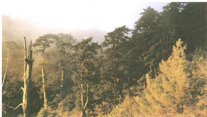
涼溫帶山地針葉林的鐵杉（大雪山森林遊樂區）

玉山箭竹原為台灣高海拔地區的特有種類，後來亦發現菲律賓呂宋之高山地區；其地下莖合軸叢生型，因桿柄能延長，故竹桿可為散生，竹桿高45-60公分，徑粗約0.4公分。群落分佈的地段與灌叢分佈區相若，常與台灣冷杉林或高山杜鵑灌叢和亞高山草甸交錯分