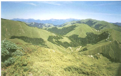
台灣中部合歡山亞高山冷杉針葉林、玉山箭竹燒林及亞高山灌叢（高山杜鵑及香堇）

北回歸線通過島中央位置，等於劃分了南、北兩個不同的氣候—植被區域，即熱帶季雨林、雨林區域與亞熱帶常綠闊葉林區域。