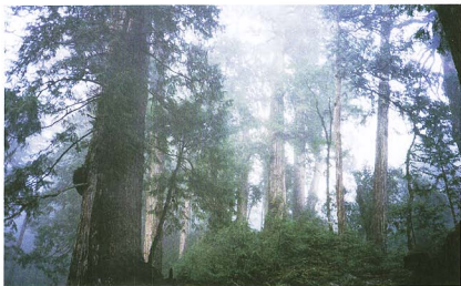
逐漸老齡化的櫟屬櫟木林準恆盛相

台灣生態環境的最大特色，殆為其由北向南的縱貫山系的複雜變化性。所謂台灣“百岳”，超過海拔三千公尺以上的山系比比皆是，最高峰的玉山主峰達3,996公尺。以中央山脈山系山體地形複雜的程度而言，台灣可以比擬歐洲的阿爾卑斯山系、美西海岸的內華達山系、亞洲的喜馬拉雅山系、日本的縱貫山系