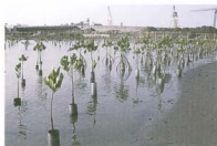
照片3：施工便道旁 50cm PVC 管紅海欖苗木生長良好 胎生苗長出，但至 2001 年 6 月底時，已見母樹上懸掛 2-3 支胎生苗。