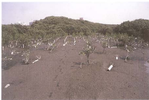
照片8：淺水區為沖蝕最嚴重地區，大潮常導致PVC管苗木傾倒

水區，亦或在泥濘且污染嚴重之地區，但因多為PVC管栽植之苗木，因此苗木生長情形尚稱良好。栽植一年二個月後，平均苗高為43.8 cm，平均地徑為17.6 mm，少數生長較佳者已具有開花能力。至今因復育區栽植之苗木過於茂密，無法計算實際成