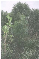
照片7：需持續觀察林分疏間後，欖李之生長是否能恢復

Lewis和Streever (2000)曾指出栽植較大的紅樹林苗木樹冠並不會提早鬱閉，而且大苗木較一年生苗木貴約10倍，雖然終年均適合栽植，但仍以春植為佳。本試驗在1998年5月將事先經1.0% NaCl鹽分馴化培養之苗木，在復育區內共計栽植80株。惟栽植後適逢藻類大量繁殖季節，若無海茄苳保護之苗木，被藻類覆蓋之情形相當嚴重，成活率僅約50%；但有海茄苳保護之欖李苗木，若生長良好者，第一年之苗高可達110