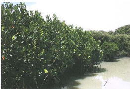
照片 2：1996 年栽植在水道旁之紅海欖稚樹生長極佳

第一區僅為一排沿魚塭護坡生長之海茄苳，故株數及密度最少，其次為第二區，第三區目前每公頃有 8452 株，林分密度仍然相當大(表 1)。第一、二及第三區之族群結構均呈鐘形曲線，在 5 cm 以下之小苗數量均銳減，顯示這三個區域海茄苳小苗相當少，天然更新情形已屬不佳；尤其在 2 年 4 個月內，此三區之死亡率均達 13% 左右，主要因生育地有限且林齡較大，林冠已鬱閉造成陽光不易透入林內，不