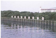
照片 9。健康路水道設有醒目之紅樹林保育區標誌