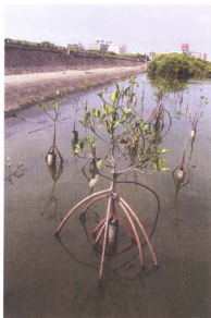
照片6，被害紅海欖苗木已見新葉萌發

相較，因根系較晚接觸土壤以利養分吸收，因此各項形質生長均較差(表3)。另外，經多次補植後，目前深水區栽植於150cm PVC管內之1-2年生紅海欖苗木，共計328株，至目前尚未長出支持根。