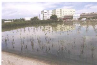
照片5，深水區紅海欖PVC管苗木約50%被啃食形蟲