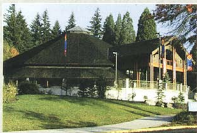
世界森林中心—博物館。

世界森林所，為一提供森林相關資訊的單位，供世界各地的研究人員、政府機關、商人及民眾使用。目前所提供之資訊主要為木材產品、市場趨勢、技術發展、國際木材產製品的交易趨勢等，另透過國際合作，提供對等經費給其他國家人員到此進行為期六