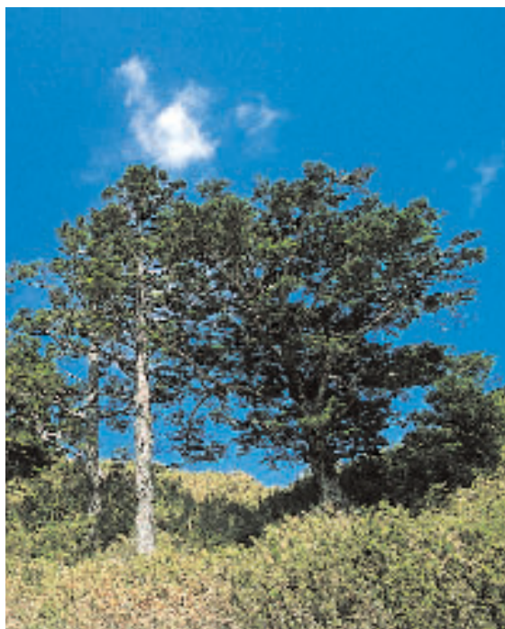
我們必須減少經濟失誤和扭曲而導致的造成森林生物多樣性喪失的決定