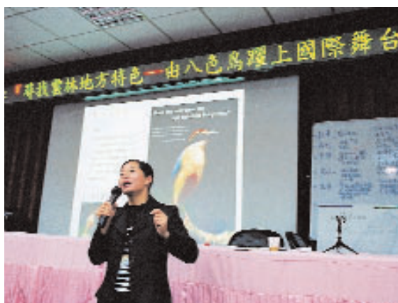
藉由保育，讓雲林湖本躍上國際舞台