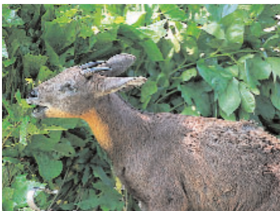
野生食用動物的利用需要法規的配合

(i)以參與方式與主要相關利益者協商，查明以不永續方式採伐非木材森林產品，特別是野生食用動物和有關產品的主要問題並確定優先事項。