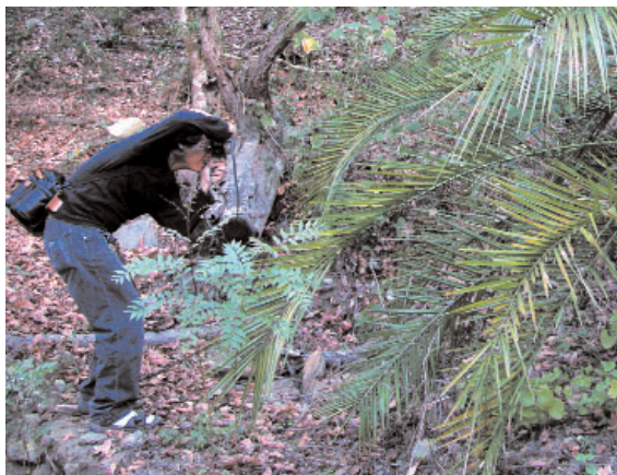
為保育和永續利用森林生物多樣性，酌情在優先地區展開具體的森林生態系調查