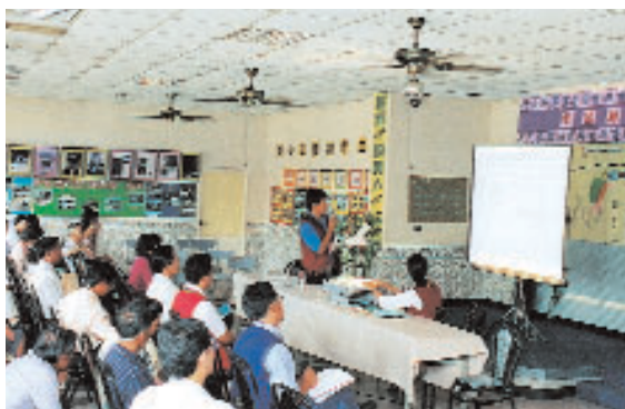
社區林業幫助地方社區制定和實施靈活的社區管理系統，保育和永續利用森林生物多樣性。