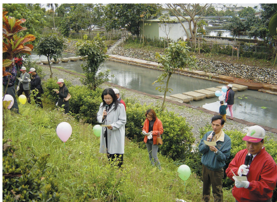
宜蘭縣長夫人田秋堇女士帶動宣讀「社區生態公約」

九十二年植樹月系列活動三月一日與崙埤社區舉辦「春來種樹聽溪語」植樹活動，在九寮溪畔共同種下烏心石、台灣紅榨槭等二千株樹苗，為九寮溪封溪護魚保育溪流生態環境再注入清流活水。