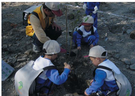
中興國小的小朋友在昔日的貯木場種樹預約屬於自己的森林教室