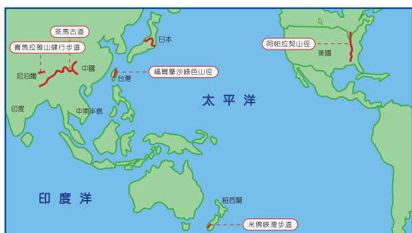
圖一 世界級步道分佈圖

於南島的米佛峽灣公園，近年來在國際上聲譽響亮，它擁有舉世聞名的米佛峽灣和冰河美景，因為電影「魔戒」首部曲、二部曲，選擇在此取景，隨著「魔戒」二部曲的票房橫掃全球，也使得這裡成為全世界觀光客必定造訪的聖地（請參考圖1）。而除了先天上的優勢外，紐西蘭政府推廣觀光的努力，更值得嘉許。其中，紐西蘭的女總理，為了將米佛峽灣內全長55公里的米佛峽灣步道推上國際舞台，還特意全程行走，透過傳播媒體的力量，將米佛峽灣之美，傳遍國際。