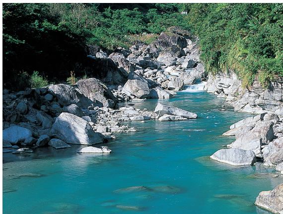
▲富源國家森林遊樂區。

富源國家森林遊樂區自九十三年六月一日起休園，由蝴蝶谷實業股份有限公司進行相關設施之興建，另為兼顧生態保育工作，將規劃植栽蝴蝶蜜源植物及撫育螢火蟲生育工作，預計於本（九十三）年十月底重新開園，讓遊客有耳目一新的遊憩體驗。（林務局 盧英秀）