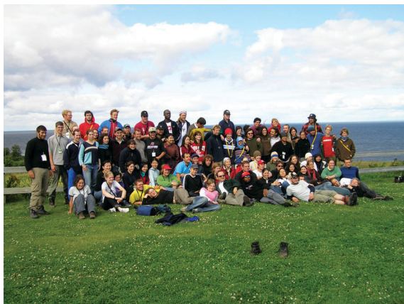
照片1 第32屆IFSS，2004年於加拿大。

2004年8月24號，第32屆國際森林學生研討會 IFSS（International Forest Students' Symposium）在加拿大東岸舉行（照片1）。該年的主辦單位是多倫多大學森林系學生，先在校區進行兩天的室內研討會，再坐遊覽車實際走訪加拿大東部的森林，十天的行程中一路往北到魁北克省繞了一圈再下來，考察了當地最大的私有林－Haliburton，林區的管理人員向我們說明他們的經營策略，如解釋使用Horse Logging的優點跟缺點（照片2）；到Waswanipi部落與原住民相處，討論社區林業及發展的問題；參觀加拿大生態中心CEC（Canadian Ecological Center）、魁北克楓糖廠、生態保留區，最後再回到多倫多公園High Park探訪都市林。白天有緊湊的參觀活動，晚上除了一些文化交流、舞會之外，幾乎每天晚上還要開會到半夜！看大家認真的討論著最新的環境議題、遴選下一屆會長及各個代表（照片3），讓我不禁驚嘆這個組織旺盛的活力與行動力。活動後，我很快的加入這個組織的群組寄信名單，並時常拜訪他們的網站