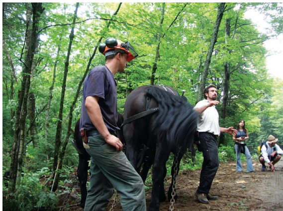
照片2 Haliburton的第二負責人向我們解說伐木作業的流程。

（ http://www.ifsanet ），並希望透過這篇文章的介紹，讓更多台灣的森林人認識這個組織。