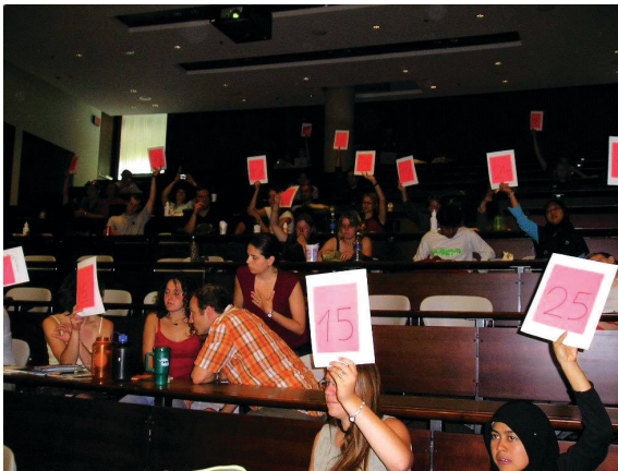
照片3 會員國於年度大會(General Assembly, GA)進行表決的投票過程。

國際森林學生組織 (International Forest Students' Association)，簡稱 IFSA，1973年始於英國舉辦第一屆IFSS年會，主要的目的是提供各國森林學生有個互