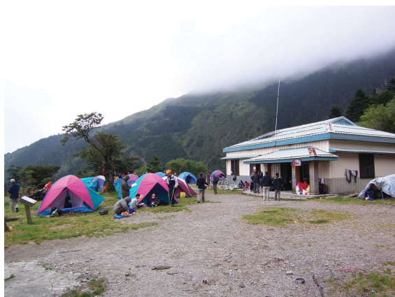
▲ 露營地監測項目，應包含露營行為對實質環境（如地被植物覆蓋度、土壤密度）之衝擊，以及遊憩體驗品質（如帳位距離）之監測。

自然資源政策將資源的管理區分為「保存（preservation）」與「保育（conservation）」