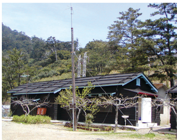
▲舊世紀建築—雲海保線所。