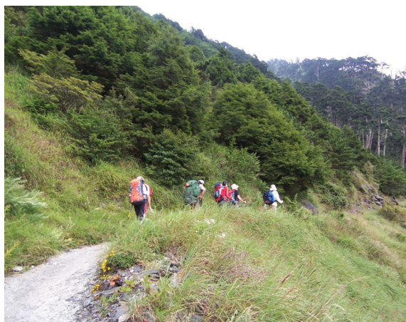
▲新世紀使用—能高越嶺國家步道。

的轉變而有所調整。例如，能高越嶺道原為日據時期軍事理番及保線道路，光復後為台電公司之電力保修為主，而今能高越嶺道被指認為「合歡能高國家步道系統」，因此資源管理單位應體認步道功能之轉移，在步道設置及管理上應朝向自然生態體驗、環境教育及休閒遊憩的管理思維，在山林資源保護的原則下提供高品質的自然生態體驗機會。