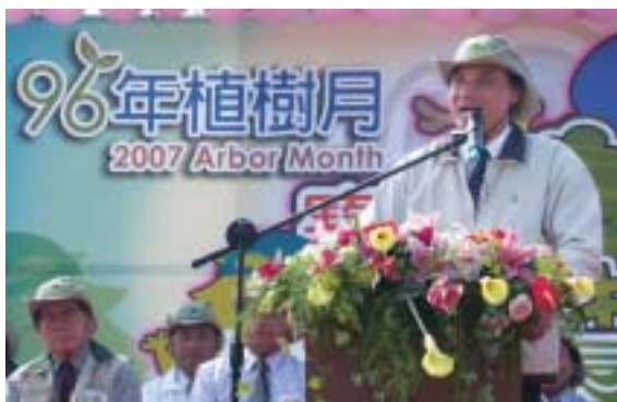
▲農委會蘇主委蒞臨植樹活動並致詞。

以「愛林護土，由我做起！」的精神所舉行的「寶貝森林總動員·大同世界慶團圓」植樹活動，3月2日上午9時在屏東市長安里公園預定地熱烈舉行。行政院農委會蘇主任委員嘉全、屏東縣曹縣長啟鴻、林務局顏局長仁德、屏東林區管理處莊處長樹林及大同