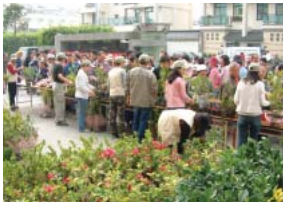
▲民眾熱情參與贈樹活動。

屏東林區管理處慶祝植樹節及推行綠美化運動，鼓勵民眾廣植樹木、綠化家園，特別趕在農曆新年前的2月11日，在該處辦公廳前廣場，免費贈送桂花、樹蘭、矮仙丹、羅漢松、含笑花、七里香、黃金扁柏、黃梔花、杜鵑花等5,000株樹苗。現場準備了宣導品，以有獎徵答的方式，加深民眾對樹種與