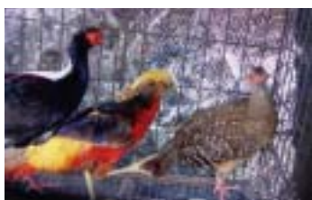
▲瀕臨絕種一級保育類動物藍腹鷓鴣。

森林暨自然保育警察隊屏東分隊、屏東林區管理處潮州工作站與內政部警政署保安警察第三總隊第二大隊第二中隊、行政院農業委員會動植物防疫檢疫局高雄分局等單位人員，於2月8日共同前往屏東縣枋山鄉台1線省道五路財神廟旁，查緝非法飼養保育類野生動物，當場查獲劉姓嫌犯未經主管機關許