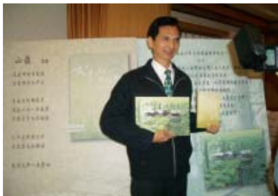
▲「太平山的故事」、「太平山古往今來－林業歷史」新書發表記者會。

1982年直營伐木作業結束，1983年設置為太平山國家森林遊樂區。在今年3月21日所出版的「太平山的故事」、「太平山古往今來－林業歷史」二書，書中忠實記錄太平山林場先人?手胼足奮鬥的流金歲月，讓讀者飽覽太平山林場歲月的絕代風華，並為這片生機盎然的山林鋪陳一片繁花似錦的未來。該二本新書，可向政府出版品展售處（國家書坊台視總店、五南文化廣場）及太平山國家森林遊樂區服務站販賣部洽購。目前羅東林管處已著手企劃將「羅東林業文化園區」創設的精采歷程彙編為「太平山古往今來－風華再現」一書。（羅東林區管理處 翁儷真）