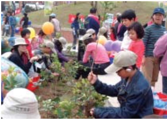
▲民衆熱情參與植樹活動。

由澎湖縣政府與屏東林區管理處共同主辦之澎湖地區寶貝森林總動員植樹活動，於3月10日在澎湖科技大學舉行，活動在澎湖縣王乾發縣長與屏東林區管理處莊樹林處長共同開鑼下熱鬧登場，並邀請20餘單位以園遊