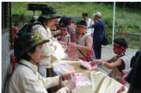
▲羅東林區管理處國家森林志工現場指導民眾製作豬年燈籠DIY。

羅東林區管理處為提升為民服務之品質，加強便民措施，在宜專一線2.2K處，興建了整合售票及驗票於一體的太平山國家森林遊樂區售、驗票站，已於日前完工，並於3月31日(星期六)上午11時辦理啟用典