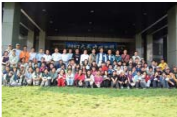
▲所有參加人員合影於屏東縣政府前。(攝影/屏東林區管理處 羅國文)

東縣政府前廣場舉行開跋儀式，屏東縣長曹啟鴻致詞表示，從第1屆開始辦理到今年第10屆，各項籌備到執行，參與投入的心力，都是為了屏東縣的子弟，也為屏東縣帶來觀光產業；屏東林區管理處莊處長樹林致詞時期勉參加的學生，挑戰大武山就好比挑戰自己的人生成長過程，有努力才有收穫。為推動無痕山林，本活動贈送每人一把小鏟、一個夾鍊袋、一本戶外倫理手冊，希望每人都能付出一點心意愛護環境，讓我們的山林擁有清淨的水資源。11時50分在登山口由原住民長老乞靈儀式後，以及鍾佳濱副縣長帶動隊呼後宣布開始為期3天的活動。(屏東林區管理處 羅國文)