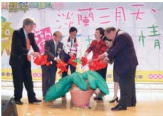
▲「淡蘭三月天、歡樂植樹情」活動開幕儀式。

羅東林區管理處繼落實轄內社區綠美化有了具體成果之後，觸角進一步延伸到校園。今年植樹月寶貝森林總動員系列活動重頭之一，就是與淡江大學於3月10日上午9時假該校蘭陽校園合辦「淡蘭三月天、歡樂植樹情」活動。活動內容包括縣內大專院校創意秀競賽、校園踩街、啦啦隊表演、校園植樹、綠美化績優社區暨林業有功人員表揚及贈送樹苗等，校園植樹更種植了烏心石、香