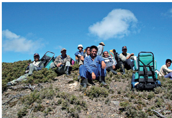
▲這群頂天立地的男子漢誓死守護花蓮群山。