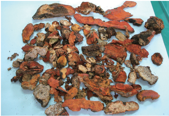
▲查緝違法嫌犯後所取出的上等牛樟芝。