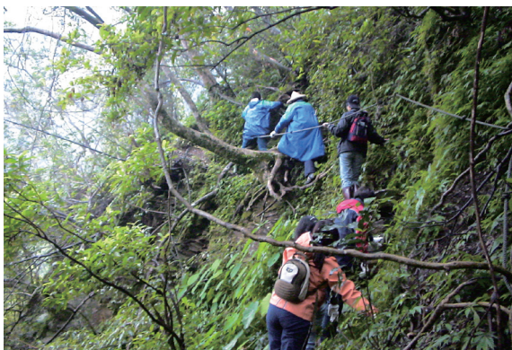
▲攀岩走壁，勾勒夢幻中的步道。

步道的排水工程攸關是否容易毀壞及日後維修，傳統工法用水泥處理，施工簡單，但不透水不符生態，這不是羅東林管處要的。當小野溪變成大溪流，要處理過水路問題，得挖開下方填大石頭，然後再以小卵石、土壤或木屑鋪設表層，因石頭之間有縫隙，留了路給水走，水才不會橫衝直撞把步道沖毀。