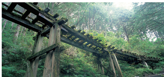
▲自然步道貴在自然，把尊重生態放在第一位。

有鑑於以前開的步道，常被批評成「山中的大拉鍊」，這次，自然步道被賦予深切期許，希望以既有的路徑為基礎，找出特有的內涵，打造具有歷史、文化、生態、生命和靈魂的步道。專家學者擔心，若採用傳統發包方式，這目標恐怕很難達成，因此建議改採統包方式。