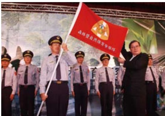
民國93年7月，森林暨自然保育警察隊成立