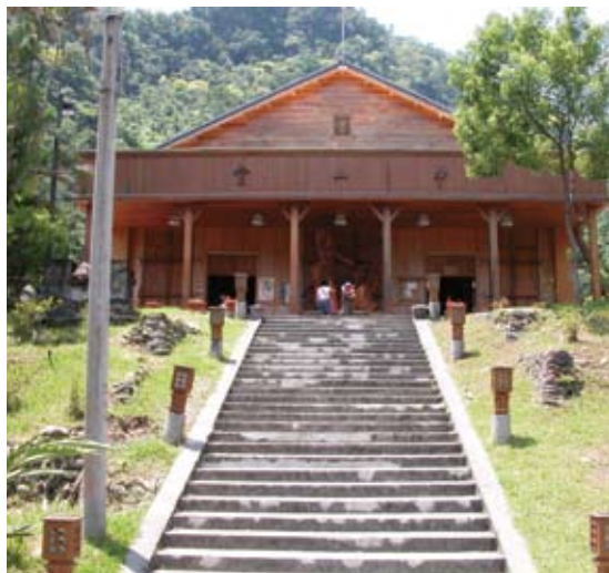
依傳統工法回復原狀的林田山文化園區中山堂。