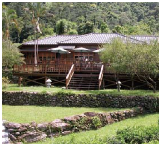
林業文化園區不僅保留林業文化資產，也促使林業閒置空間之活化利用，圖為林田山文化園區。

辦理「國家自然地景保育及教育宣導計畫」，進行320處地景普查登錄、地景保育宣導及人員培訓，提升地景保育工作之正面形象與地位，並作為將來設置「地質公園」之準備工作及基本資料。