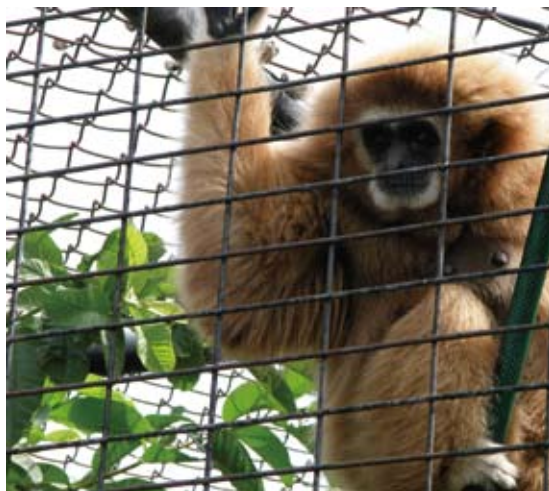
遭沒收、棄養、拾獲之動物在野生動物收容中心獲得良好之照護(屏東野生動物收容中心)。

物，給予收容、照顧管理及救傷工作，截至99年12月底止，在養收容野生動物共4,029隻。