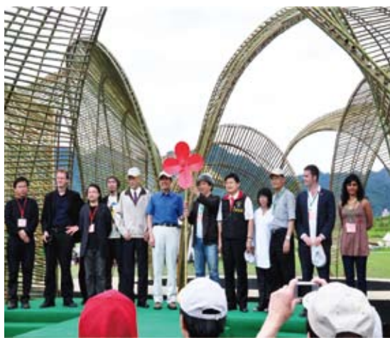
馬總統於花蓮大農大富平地森林園區國際藝術節開幕活動致詞，並與各國藝術家合影。

為因應行政院組織改造，積極協調相關單位及籌備轉型為「環境資源部」轄下之「森林及保育署」各項準備工作，並已獲立法院司法