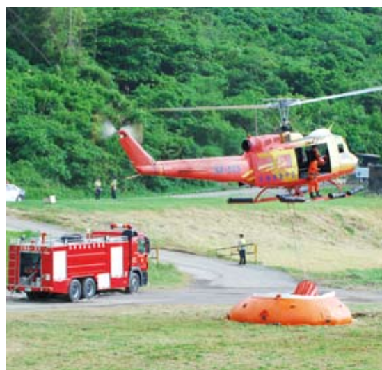
林務局與國防部、內政部成立跨部會空中滅火機制，定期舉辦陸空聯合演練。