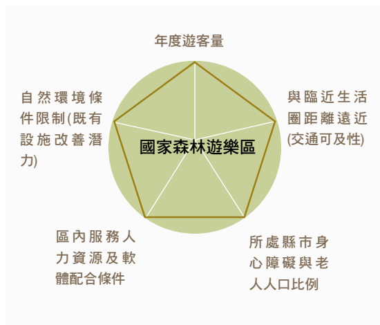
圖2 國家森林遊樂區無障礙設施改善條件評估指標架構