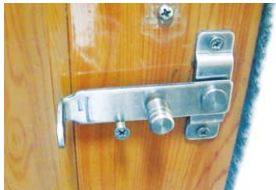
已改為調撥式門鎖，以利手部肢體障礙者使用。