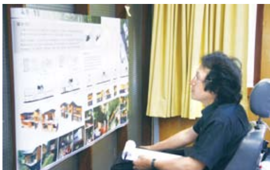
評審委員仔細審閱每件參賽作品

「無障礙住宿空間」對於行動不便者在旅程中是非常重要且必須考量的一環，但國內尚無明確的規範可依循，而建築設計領域亦鮮少討論。林務局特別以八仙山國家森林遊樂區為競圖基地，辦理了「林務局國家森林遊樂區無