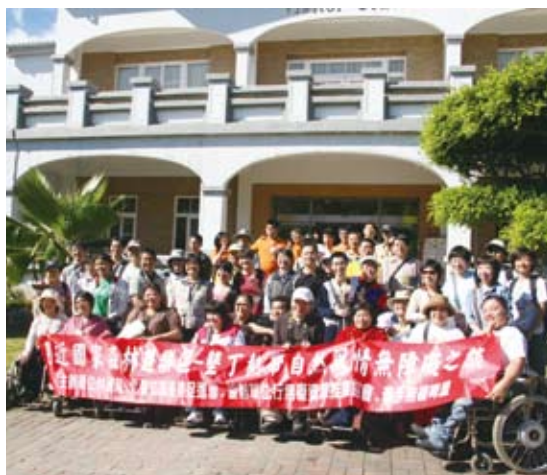
圖身障朋友的一個夢

為使行動不便之族群及其家屬有機會親近大自然，林務局於99年至100年先後假墾丁及內洞國家森林遊樂區辦理4場次無障礙旅遊活動，