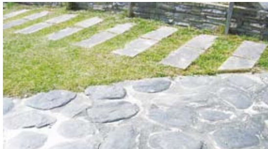
藥用植物區路面顛坡，不利輪椅行進。