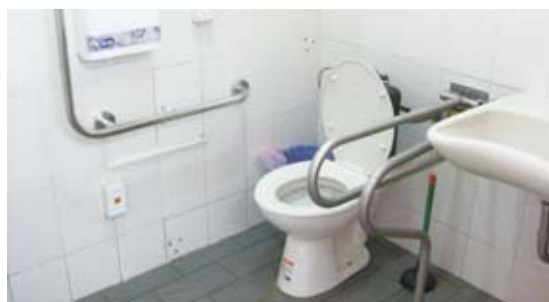
置換一般馬桶，並改善扶手錯置情形。