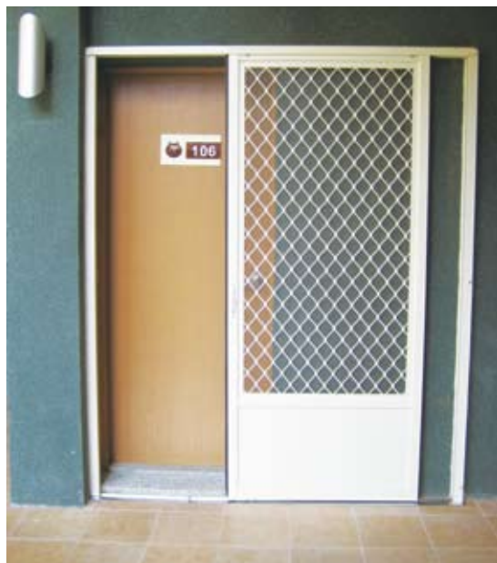
將房間入口門檻移除，並將紗門改為水平開啟式，以利行動不便者使用。