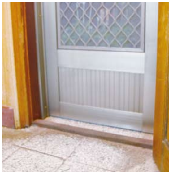
房間入口有一門檻，輪椅不易進入。