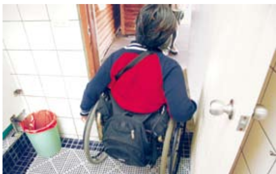
實際檢覆各項無障礙設施

障礙環境創意設計競圖」活動，希望將通用設計之概念導入國家森林遊樂區之住宿環境，並期望大專院校建築、景觀、設計等相關科系能夠開始重視無障礙環境之營造。更希望藉由競圖活動讓產、官、學界逐步形成溝通及交流無障礙觀念的平台。