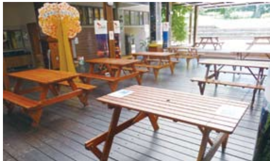
購置可供輪椅接近使用之餐桌

慮部分國家森林遊樂區內設置有自然教育中心，為利參加學童與家庭於環境教育或解說服務過程之多元使用，所配合設置之設施多有強化通用設計，如平坦的木質地板教室、設有較