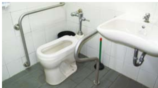
無障礙廁所採用骨科馬桶，且扶手錯置。