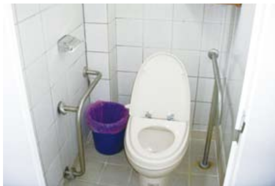
扶手錯置，空間不足，無法進入使用。