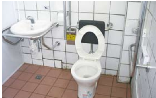
扶手更正，加大空間並增加警示鈴。