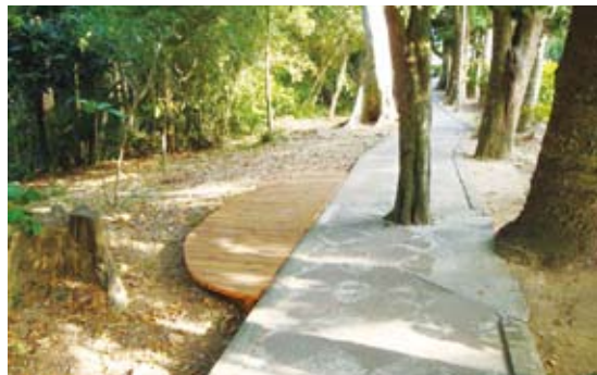
樹木立於中央之路段，增加路面寬度。