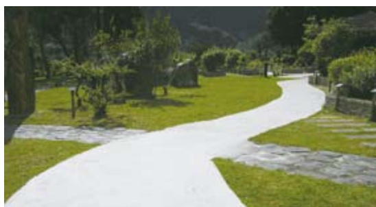
將路面整平，營造無障礙路線。