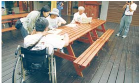
休憩座椅採固定式，輪椅難以接近使用。