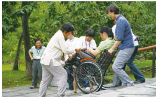
同仁實際體驗各種行動不便的狀況