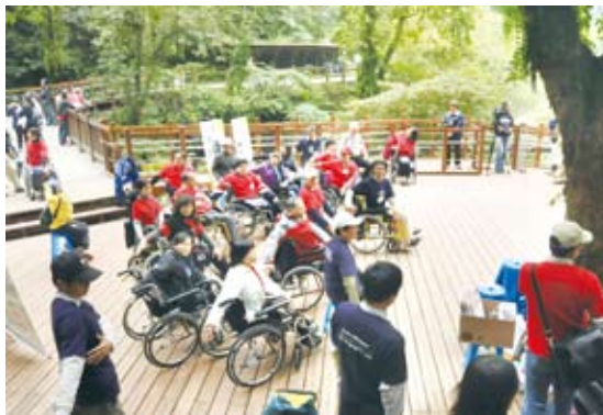
藉由平台搭建將觀瀑平台及樂水橋銜接，形成無障礙活動廣場。