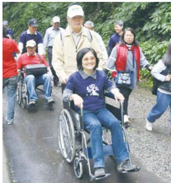
局處首長實際體驗身心障礙者的不便

參加教育訓練的同仁藉由輔具的幫助，透過角色扮演的過程，實際體驗乘坐輪椅時的不適，感受視障對於外界的恐懼、年長者身體退化的不方便。這10場次的教育訓練確實撼動了許多同仁的觀念，一個對於大家來說是微不足道的小階梯，對身障朋友來說就是一道永遠跨不過去的牆，把這個小階梯移除了，就可以為身障朋友開啟一扇窗，去看看另一個開闊的世界。林務局希望透過教育訓練的方式打破同仁