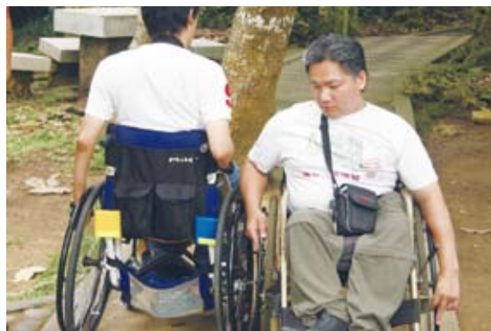
樹木立於中央，造成步道淨寬變窄，不易通過。