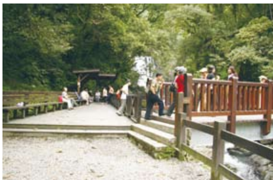
觀瀑平台設置於階梯之上，行動不便者無法進入。