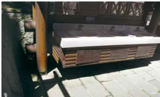
洗手台下方設置裝飾木箱。行動不便者無法靠近洗手台使用/改善前(阿里山國家森林遊樂區)。