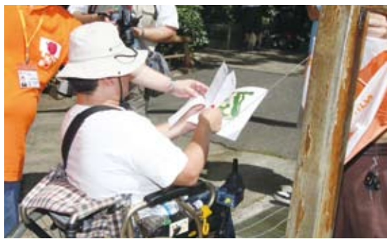
身障朋友參加墾定好玩定向運動(墾丁國家森林遊樂區)。

區無障礙檢覈計畫」，全面要求所轄國家森林遊樂區室內、室外之軟、硬體服務環境進行檢覈，並協助工作人員了解無障礙服務觀念等等改善及強化無障礙環境實際作為。