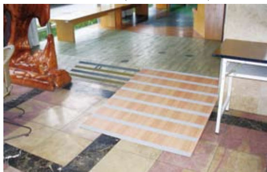
使坡度合乎無障礙規範/改善後。