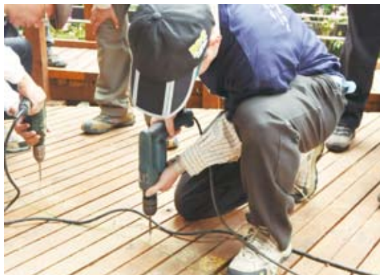
林務局同仁實際參與無障礙設施改善工作(內洞國家森林遊樂區)。

國家森林樂區無障礙環境改善示範及推動無障礙旅遊計畫，並與NGO團體、民間業者及計畫委託單位合作規劃了3月18-19日2天1夜的內洞無障礙設施改善工作假期活動。