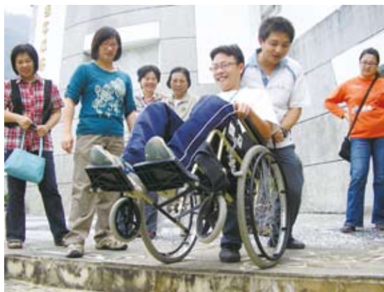
定期辦理無障礙教育訓練。

硬體設施改善後更重要的當然就是所謂的軟體設施，其中以「人心」改變是最重要的，我們分別針對假日與非假日安排了兩場體驗課程，希望不僅遊樂區工作人員可以參與，也讓