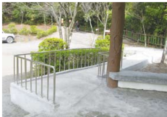
休息涼亭前已增設無障礙坡道/改善後。

我充滿了疑問？當行無礙資源推廣協會夥伴們來到奧萬大進行檢覈，發現園區已具友善的環境，輪椅的提供及嬰兒車使用，還有廣大平坦的草原、遊客中心出入口設有無障礙斜坡、無障礙廁所及住宿空間等服務設施，僅需短期基礎規劃改善，就可提供大範圍無障礙動線及遊憩服務的國家森林遊樂區。