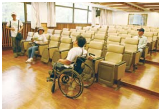
未設有專用席位/改善前(奧萬大國家森林遊樂區)。

「無障礙旅遊」顧名思義，就是沒有障礙的旅遊方式，無障礙旅遊，可分為硬體跟人為的，如果環境有缺失，可以靠人為的人力協助還是可以達到無障礙的境界，例如：住宿區即使沒有無障礙坡道，只要服務人員願意以人力協助進入，就可以達到無障礙旅遊；然而如果無障礙做的很好，也有標準的斜坡道，但是沒