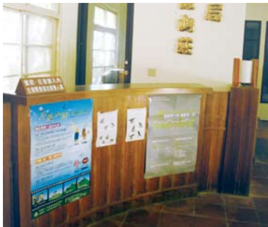
櫃檯台面過高/改善前(武陵國家森林遊樂區)。

雖然這些細微的改變，還是沒有辦法滿足大家的需求，但這只是個開端，未來東勢處仍會持續推動無障礙旅遊環境營造，並在工程設