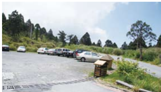
原停車場鋪面為不平整的小碎石/改善前(太平山國家森林遊樂區)。