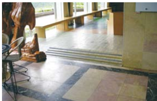
林業陳列館內坡度過陡/改善前(池南國家森林遊樂區)。