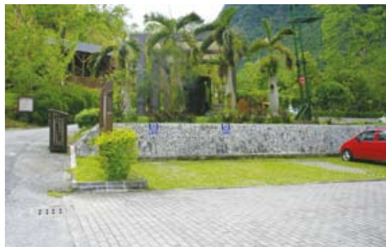
停車格以植草磚為基座/改善前(池南國家森林遊樂區)。