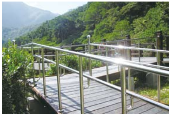
觀景休憩平台增設無障礙坡道/改善後。

假日及非假日的志工夥伴都能一一親身坐在輪椅中、體驗弱視者及行動不便者行走在遊樂區的難處，讓我們理解扶手的需求、階梯的阻礙、摺頁字體太小、輔助器的協助等……，以前視為理所當然的方便，在體驗同理心的建構下終於有不同層級的理解。