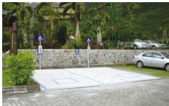
停車格改善其平整度/改善後。

個角度並無不妥，但是卻可能造成行動不便的輪椅使用者困難重重，這是同仁實際參與輪椅體驗後的感覺，那好像車輛避震器損壞非常「嚴重」時那樣的顛簸，真是痛苦阿！心想還好這只是訓練。