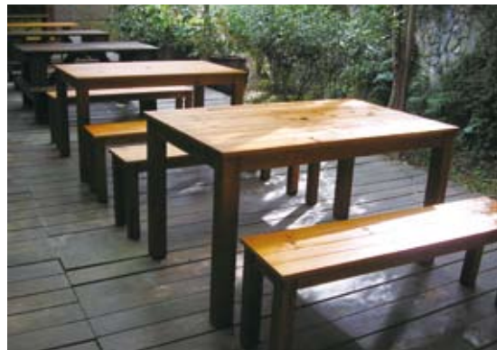
增設輪椅可靠近之友善桌子/改善後。