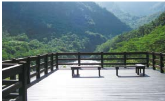
原觀景休憩平台身障朋友無法親近/改善前(知本國家森林遊樂區)。