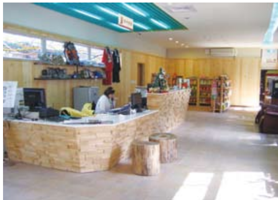
已降低高度，方便遊客親近/改善後。