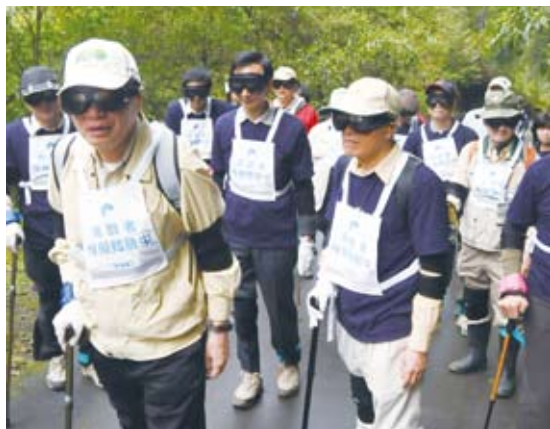
局處首長實際體驗年長者之不便(內洞國家森林遊樂區)。

為了改善轄內4個森林遊樂區的無障礙設施，新竹處自2010年10月起，陸續完成遊樂區內的無障礙停車位及廁所設置、降低解說牌高度、調整牌面角度、區內休憩椅周邊鋪設平整硬地面、設置無障礙坡道等工作。另外，為了