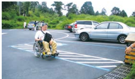
停車場鋪面已重新整平，同時劃設有格無障礙停車位/改善後。