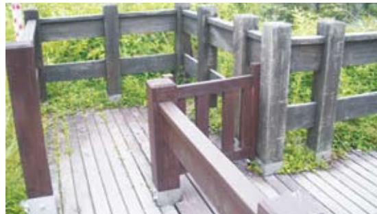
就現地之空間將入口柵欄改為調撥式，營造足夠之迴轉空間/改善後。