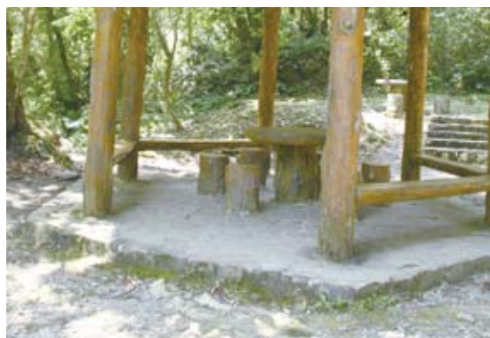
休息涼亭前有階梯/改善前(奧萬大國家森林遊樂區)。