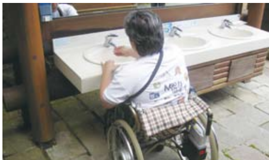
將洗手台下方淨空/改善後。

望向眼前大樹的表情，不禁讓我心裡燃起了要 多為行動不便者及老年人盡一份心力的決心， 也許一個人的力量很淺薄，但是將一份份心意 點點滴滴累積就能化成很大的力量，期望有更 多的人懂得設身處地，讓我們的社會能處處都 有愛。