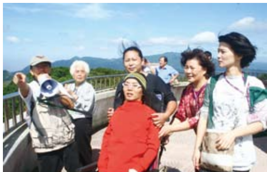
脊髓損傷朋友搭電梯至觀海樓觀景(墾丁國家森林遊樂區)。