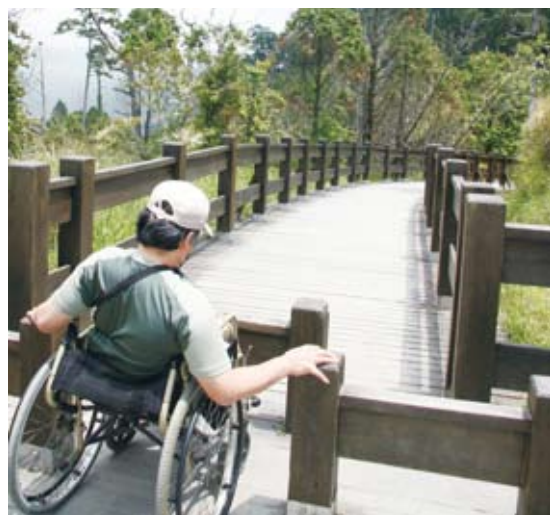
步道入口設置柵欄，行動不便者無法進入/改善前(太平山國家森林遊樂區)。

除此之外，目前遊樂區內於鳩之澤、蹦蹦車站、太平山莊等據點設有斜坡道6處，方便身障者或使用輪椅遊客進出通行；無障礙停車位6