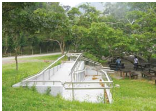
榕婆婆下坡處設置無障礙坡道(雙流國家森林遊樂區)。

林務局推動國家森林遊樂區無障礙旅環境營造過程，除硬體設施改善外，自99年至100年安排計8場無障礙旅遊環境相關課程，其中一項「扮演高齡者及身障、視障者環境體驗」課程讓我們感受非常深刻，當老師以不透光的眼罩矇起我們的眼睛那一霎那，心中突然湧現不安及恐懼，完全不敢往前走動，即便身旁有一位陪伴者、有扶手等等輔助，但就是害怕；另老師還安排我們坐輪椅上下電梯、廁所、階梯及斜坡等等。哇！真是處處危機、處處障礙，為什麼廁所不做寬一點、坡道不做緩一點或平整一些？為什麼輪胎會卡在水溝格柵上，動彈不得！這些小小的體驗卻給予我們那麼大的震撼及感受，重要的是我們有了同理心。現在我們知道設置水溝格柵的開口不得大於1.3公分；坡