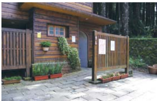
受鎮宮廁所前石板路面不平整/改善前(阿里山國家森林遊樂區)。