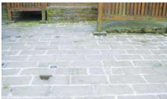
已改善鋪面或調整間隙在2公分以內/改善後。