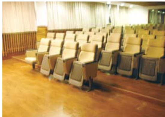
拆除視廳室最前一排兩旁座椅，供輪椅者移位觀賞/改善後。

有人幫忙推上斜坡道，也是會有障礙的，因此，所謂無障礙也是要環境跟人的愛心相輔相成，才能真正的達到無障礙。