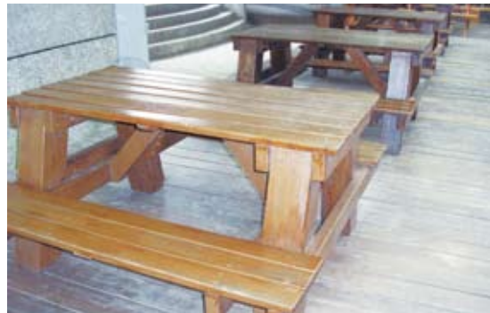
原桌椅輪椅無法靠近/改善前(知本國家森林遊樂區)。

工作人員及志工們不辭辛勞，翻山越嶺的至各國家森林遊樂區現場實地勘查，我原以為知本情況應不嚴重，但從大門開始卻已是阻礙重重，無身障者指引標誌、無親切的服務鈴、購票平台坡度過高、遊客中心雖有無障礙廁所卻是連用詞(以前稱殘障廁所)都錯，且裝設方式不管是扶手或門都是無法讓身心障礙者使用的十幾年前錯誤規範，另小小的門鎖、水龍頭開水的方式及水槽、鏡子裝設的高度原來也都是大學問。門檻的高度不可超過2公分，木平台順個坡道，輪椅就可輕易上去，我們認為最自然的高低石板道及防滑的顛簸路面原來對他們來說也是一種折磨，多媒體室的空間配置拆一兩組椅子即可更符合身障者的需求……，這樣鉅細靡遺的指正下，我們終於明白身障者到底需要